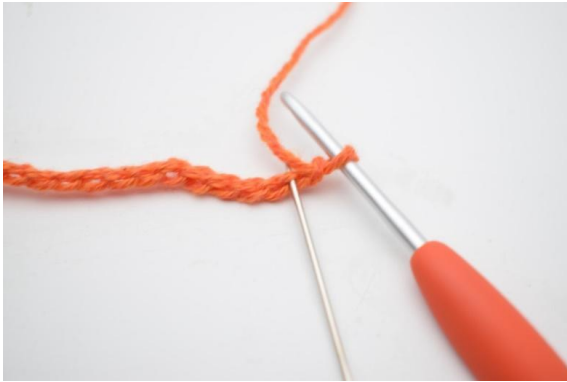
3. In die 2. lm ab der Nadel wird 1 fm gehäkelt.