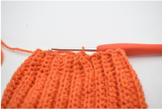
9. Genau so.