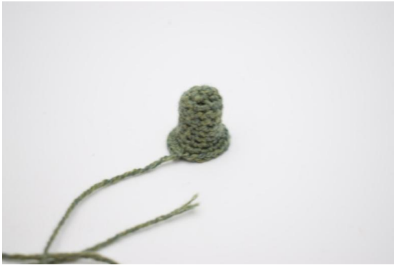
23. Den Stiel annähen.