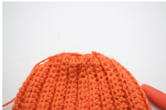
12. Auf der Runde wiederholen.