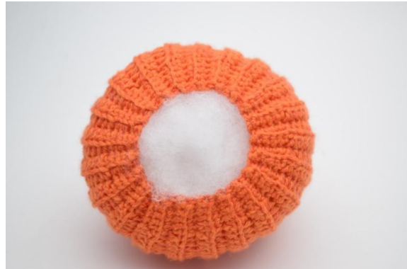
16. Mit Füllwatte stopfen.