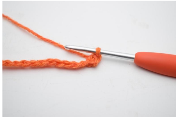
4. Genau so