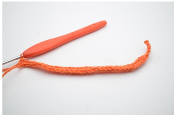
8. Genau so