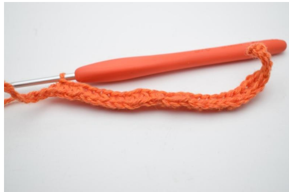
6. 1 hStb in die nächsten 20 (25) lm,