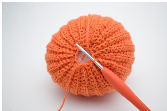
18. Genau so.