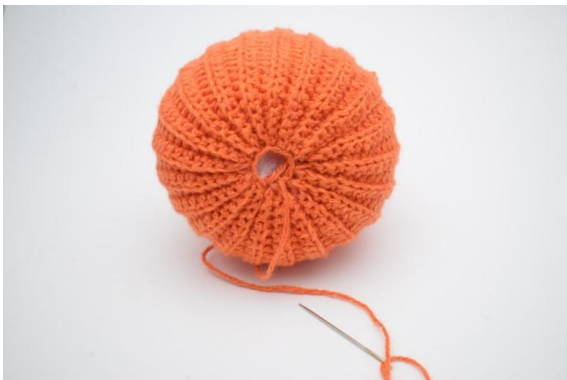
19. Den Faden abschneiden und das Loch ganz zunähen.