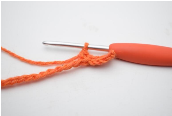
5. 1 fm in die nächsten 3 (4) lm,