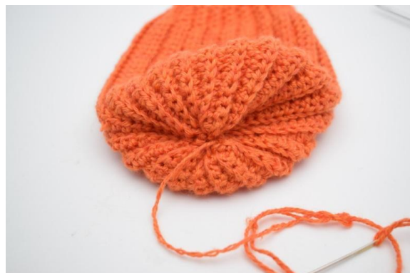
14. Den Faden abschneiden und das Loch ganz zunähen.