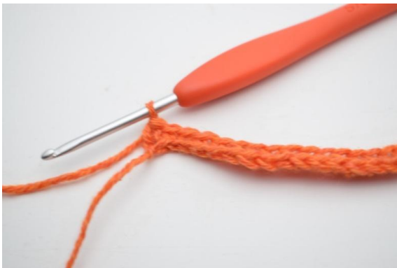
7. und 1 fm in die letzten 4 (5) lm.