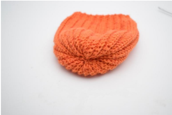
15. die linke Seite nach innen wenden.