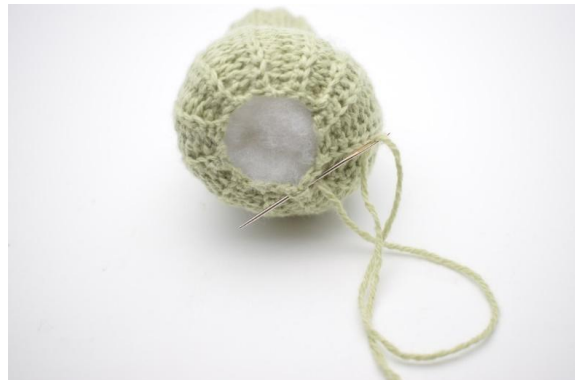
8. Den Rand am Boden heften und die Maschen zusammenziehen, bis das Loch geschlossen ist.