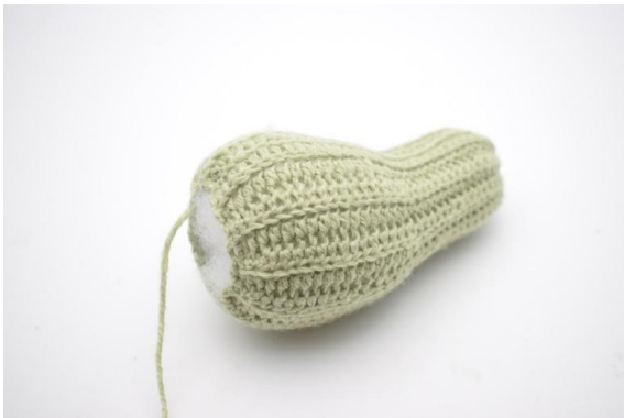
7. Mit Füllwatte stopfen und den Kürbis formen. Den Faden vernähen.