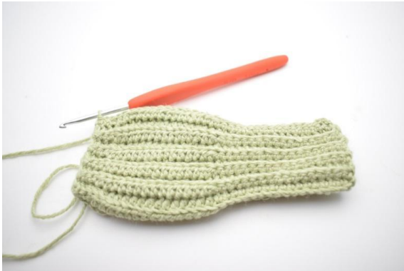
3. Genau so.