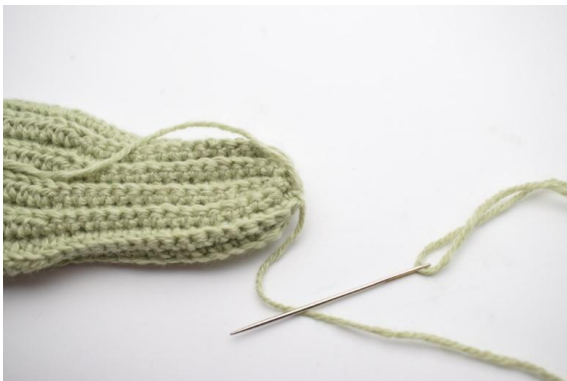
5. und die Maschen zusammenziehen bis das Loch ganz geschlossen ist.