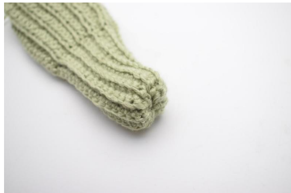
6. Den Faden vernähen. Jetzt die linke Seite nach innen ziehen.