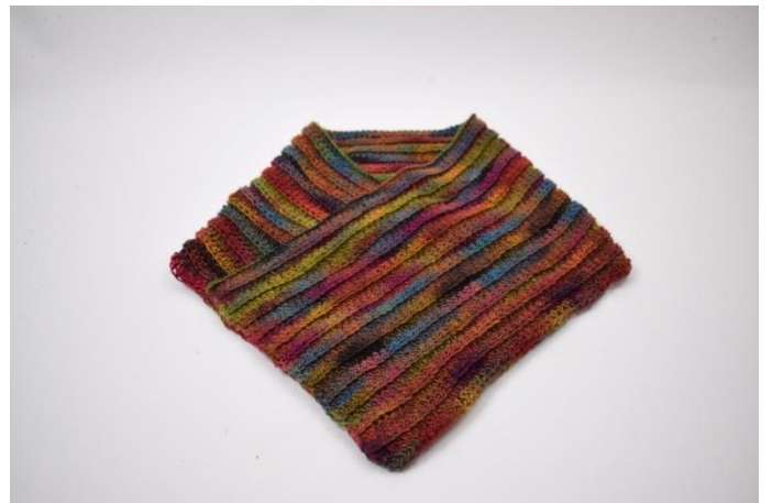
2. Das andere Ende über das erste falten, so dass sich die beiden Teile um 30 Maschen überlappen.