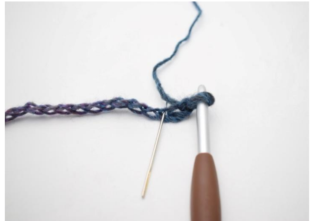
2. 1 hStb in die 3. lm ab der Nadel.