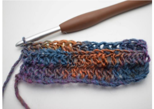
12. Auf der gesamten Reihe hStb in das hMg häkeln.