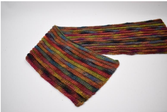
1. Falte das eine Ende zur Mitte, wie hier auf dem Bild gezeigt.