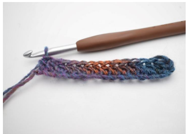
4. und hStb auf der gesamten Reihe.