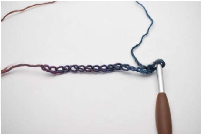
1. Die Luftmaschen häkeln.