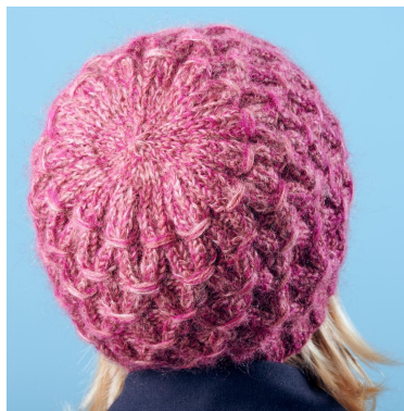
Abnahmen für die Spitze