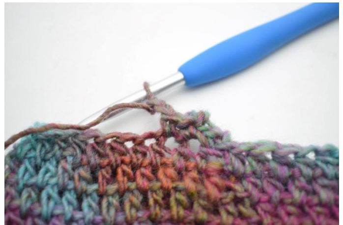
8. 2 lm häkeln.