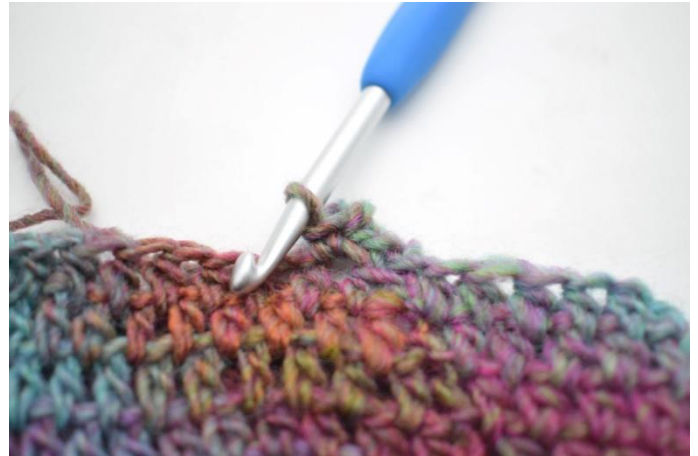
6. 1 fm in die nächste m häkeln.