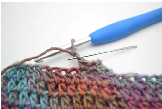
9. 1 km in die 2. lm ab der Nadel häkeln.