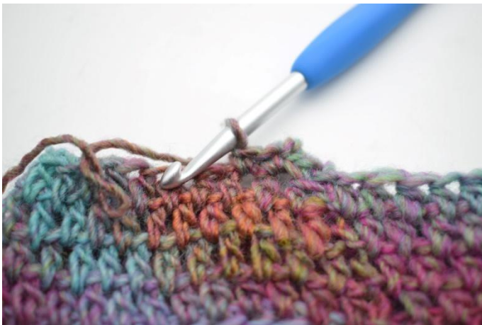
7. 1 fm in die nächste m häkeln.