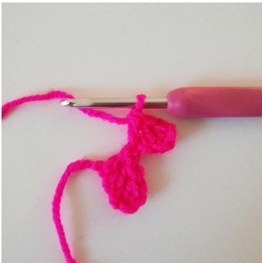
3. Stäbchen in die nächsten 2 lm häkeln. Jetzt hast du noch ein Pixel.