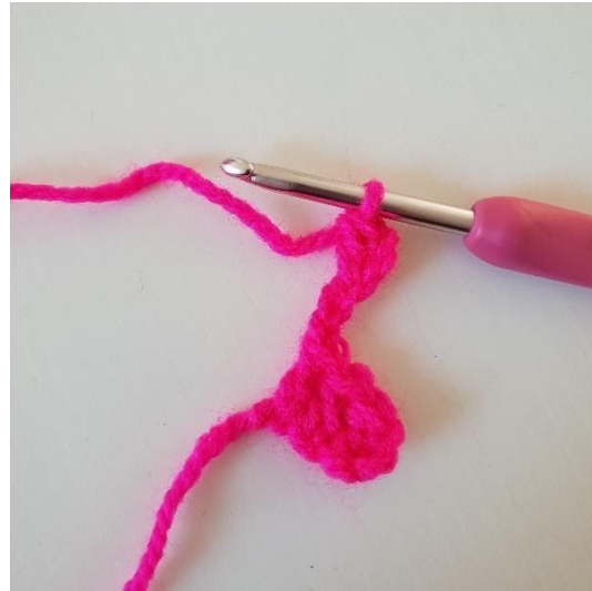
2. 1 Stäbchen in die 3. m ab der Nadel häkeln