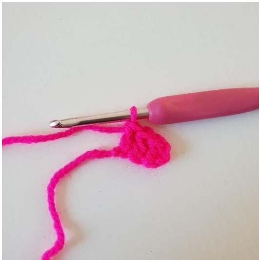
3. Stb in die nächsten 2 Luftmaschen häkeln. Du hast jetzt dein erstes Pixel gehäkelt.