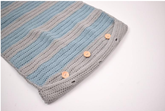
7. Die drei Knöpfe passend zu den Knopflöchern annähen.