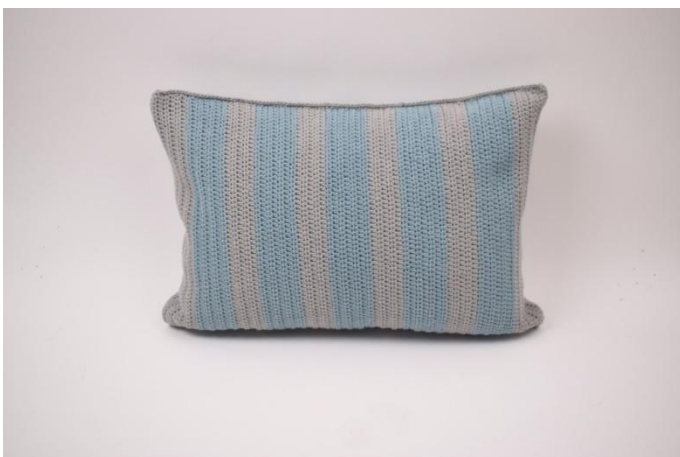
9. Und fertig.