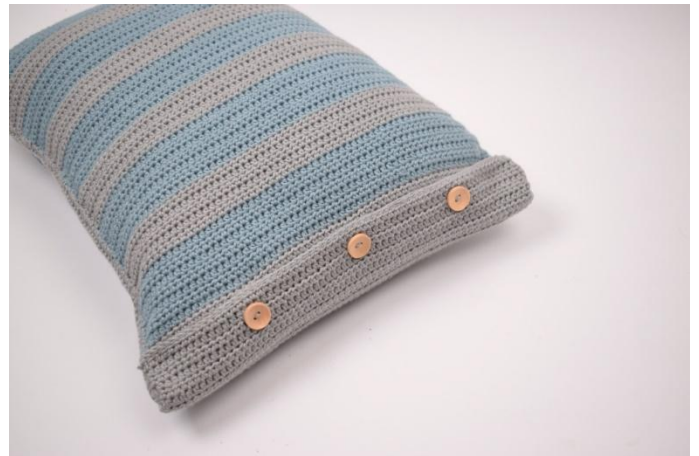
8. Das Innenkissen einlegen und zuknöpfen.