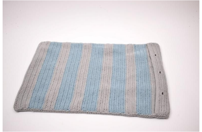
6. Auf beiden Seiten häkeln. Den Faden abschneiden und vernähen.