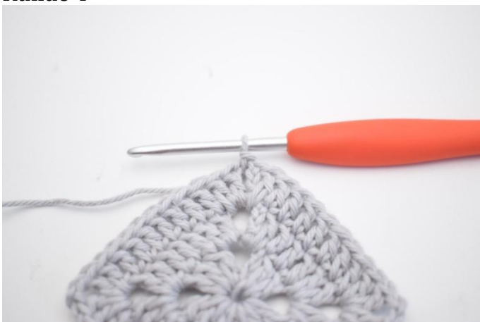
15. 1 km in den Lm-Bogen häkeln.