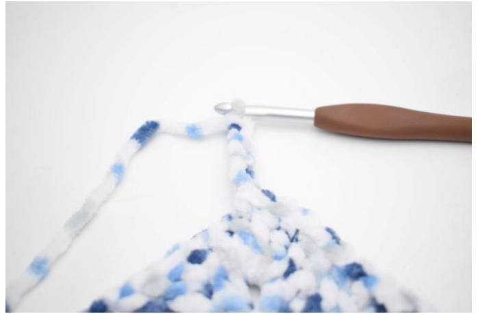
33. Bilde 6 Lm und 1 fm in die 2. Lm ab der Nadel häkeln. 1 fm in die letzten 4 Lm.