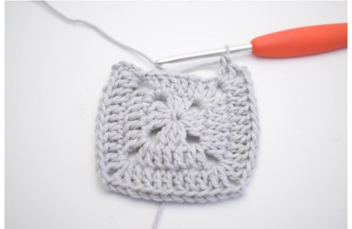
13. Von *-* insgesamt 3 mal häkeln.