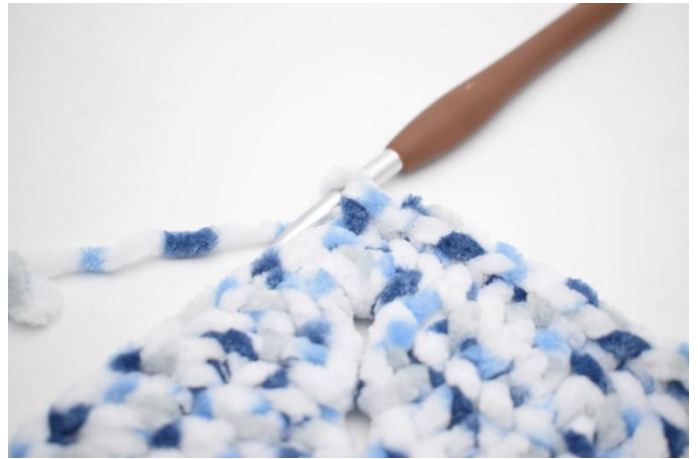
35. 1 fm in die nächsten 32 m.