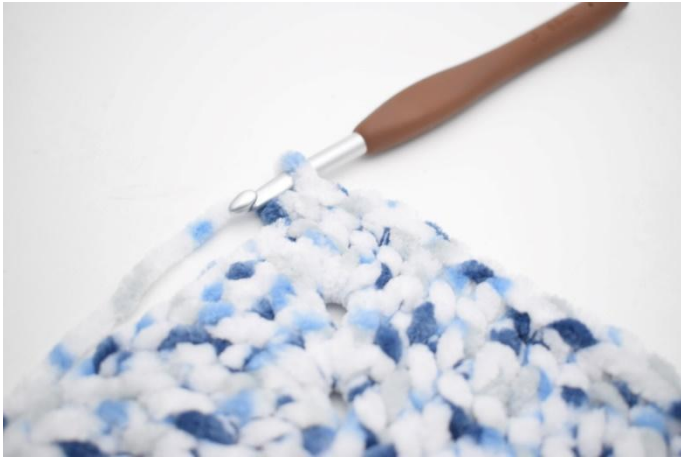
32. 1 fm in die nächsten 32 m.