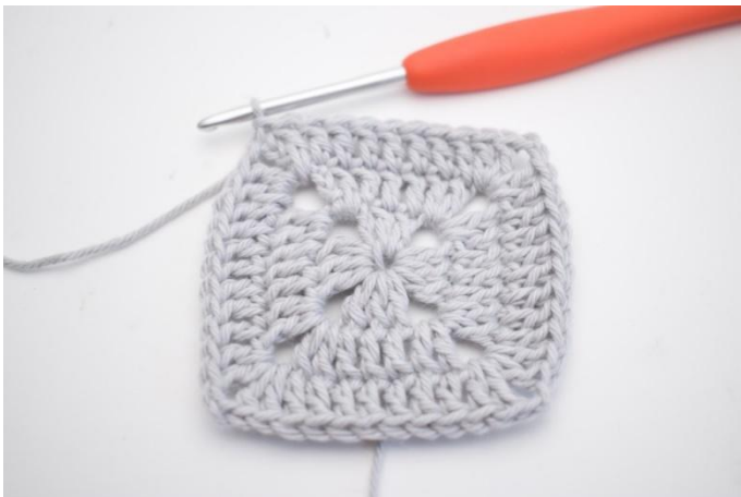
14. 1 Stb in die nächsten 7 M und 1 Stb in den Lm-Bogen vom Anfang der Runde häkeln. Schließen mit 1 Km in die 3. Lm.