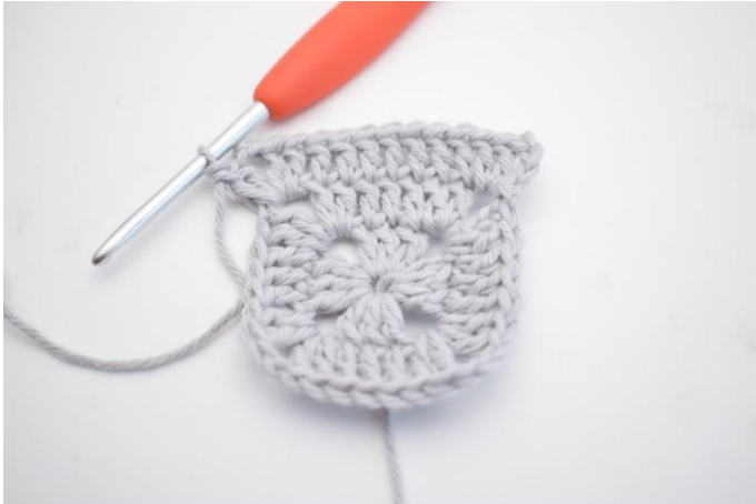
12. *1 Stb in die nächsten 7 m, 2 Stb, 2 Lm und 2 Stb in den nächsten Lm-Bogen*.