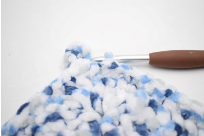
38. 1 fm in die letzten 30 m. Mit 1 km schließen.