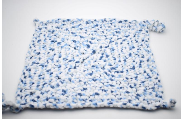
39. Den Faden abschneiden und vernähen.