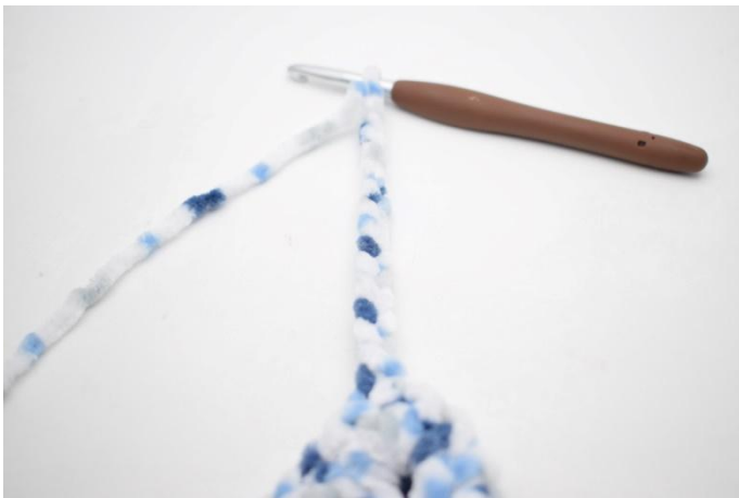
36. Bilde 15 Lm. 3 fm in die 2. Lm ab der Nadel häkeln. 3 fm in jede der letzten 12 Lm häkeln.