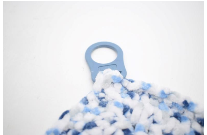
2. Den "Schnipsel" um die Öffnung im Adapter legen und festnähen.