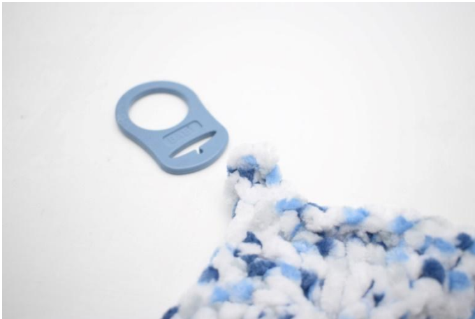
1. An der ersten Ecke wird der Schnulleradapter befestigt.