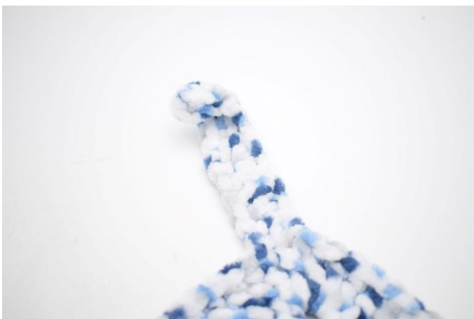
3. In die nächste Ecke wird ein Knoten gebunden.