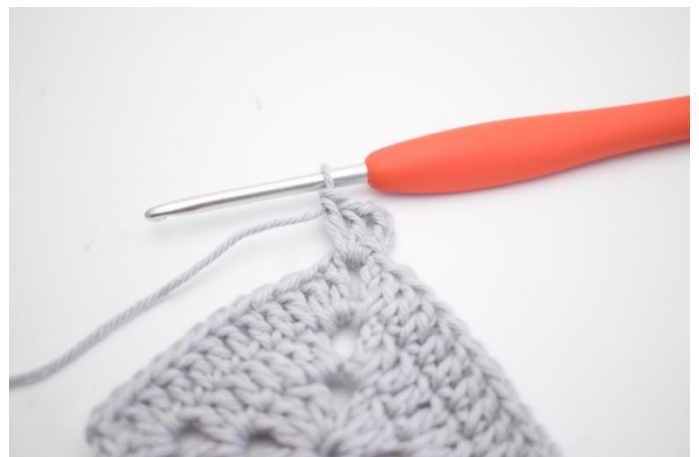
16. 4 Lm häkeln. 2 Stb in den Lm-Bogen häkeln.