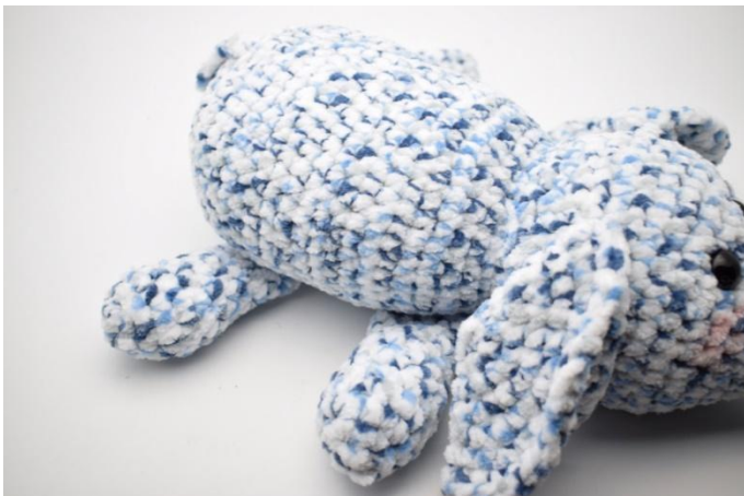
5. Die Beine unter dem Bauch des Elefanten annähen.