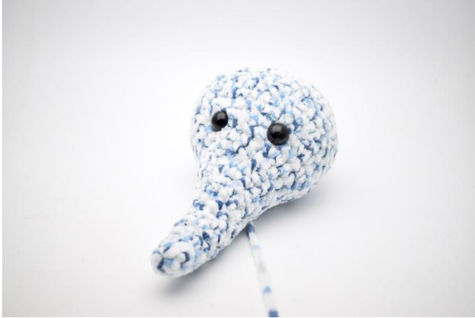
1. Rüssel und Kopf ganz stopfen.

Rüssel und Kopf ganz stopfen und die Vertiefungen für die Augen machen.