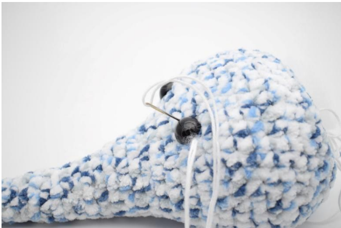
3. Die Nadel auf der anderen Seite des Auges einstecken und etwas anziehen.