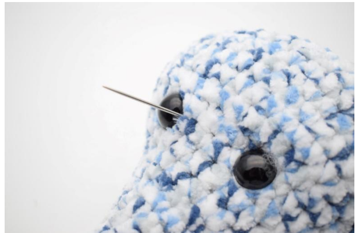
4. Die Nadel an einer Seite des anderen Auges herausziehen.