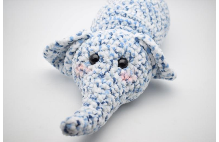
4. Evtl. etwas Wangenrot auftragen.