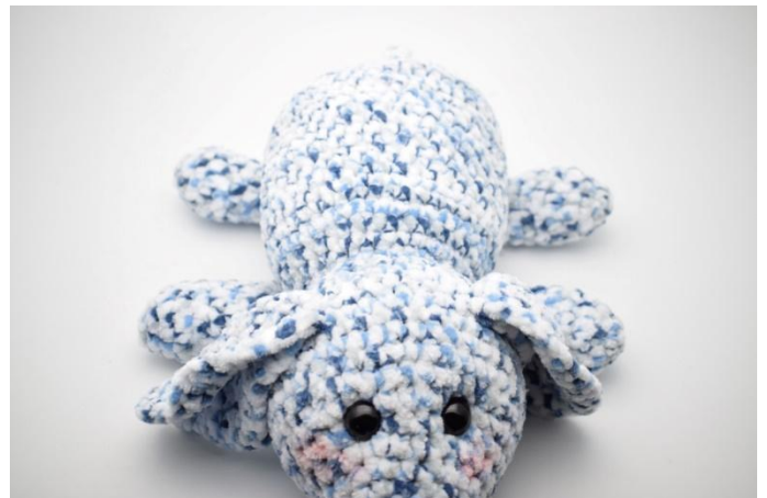
6. Genau so.