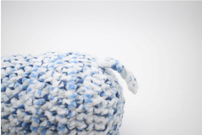
3. Den Schwanz oben an das Hinterteil des Elefanten annähen.