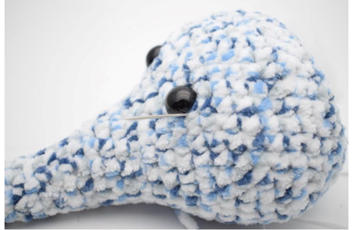
2. Vertiefungen mit einer Nadel und weißem Baumwollgarn machen. Die Nadel an der einen Seite des Auges herausziehen.