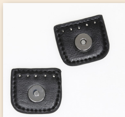
Magnetknopf mit Druckverschluss - 4 cm