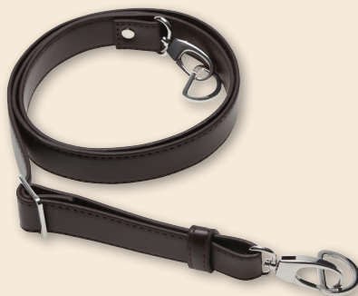
Verstellbarer Schulterriemen für Taschen - 25 mm x 130 cm