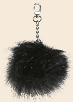
Pompon Anhänger mit Metallkette - 11 cm