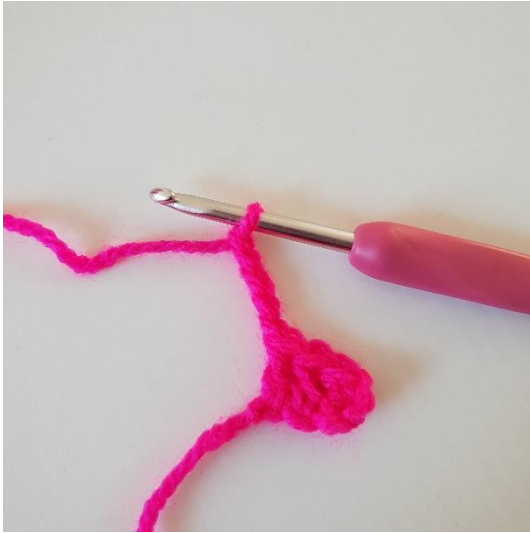
1. 5 Luftmaschen häkeln