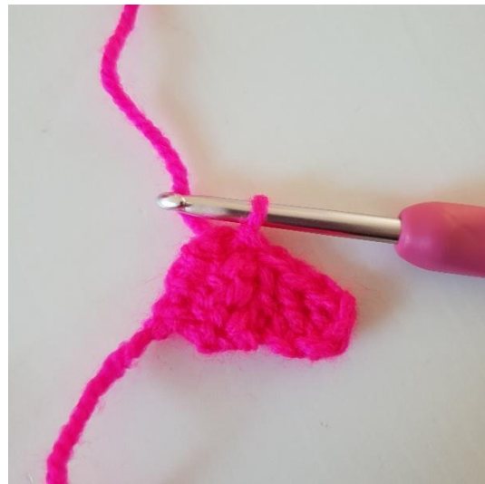
4. Nun werden das Pixel mit dem ersten Pixel zusammen gehäkelt. Du wendest das Pixel und häkelst eine Km in die linke Seite des ersten Pixel. Das Bild zeigt die zusammen gehäkelten Pixel.