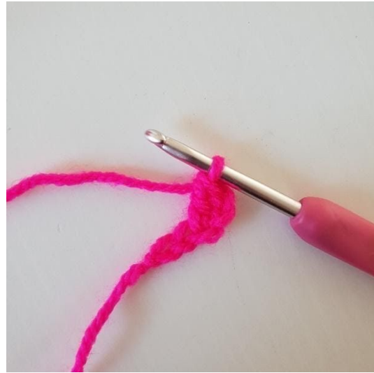
2. 1 Stäbchen in die 3. Lm