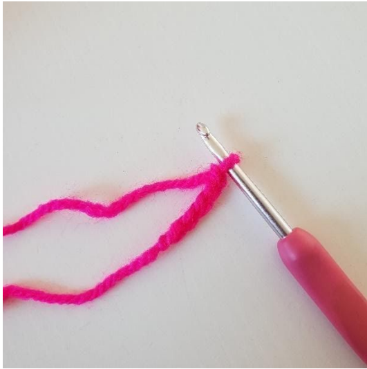
1. Beginne mit 5 Luftmaschen