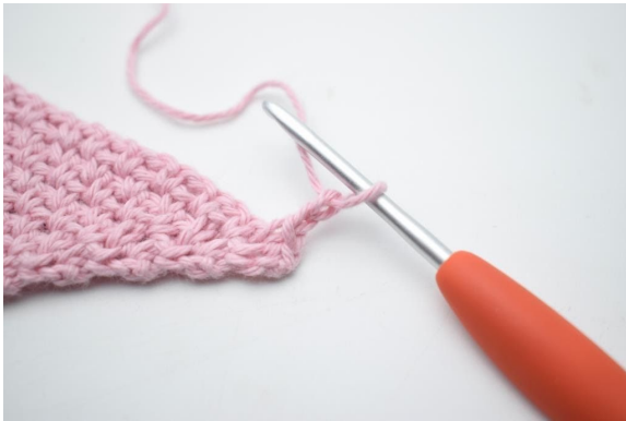
3. "Bilde 2 Lm.