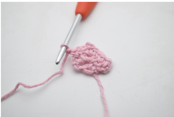
13. Bilde 1 Lm.