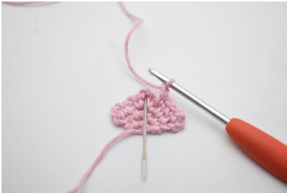
11. In den Lm-Bogen der vorherigen Reihe werden 1 fM, 2 Lm und 1 fM gehäkelt.