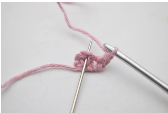
5. In den Lm-Bogen der vorherigen Reihe werden 1 fM, 2 Lm und 1 fM gehäkelt.