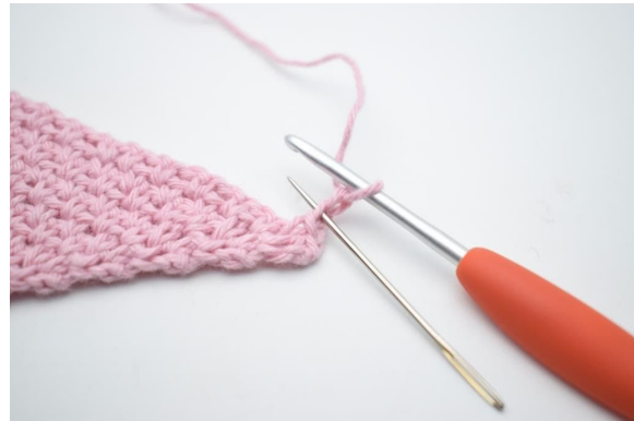
4. Häkle 1 Kettm in die 2. Lm ab Nadel.