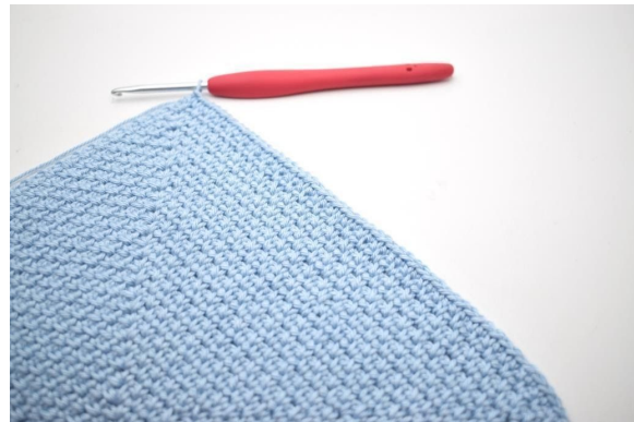
2. Häkle fM in alle M und alle Lm-Zwischenräume bis zur Spitze.