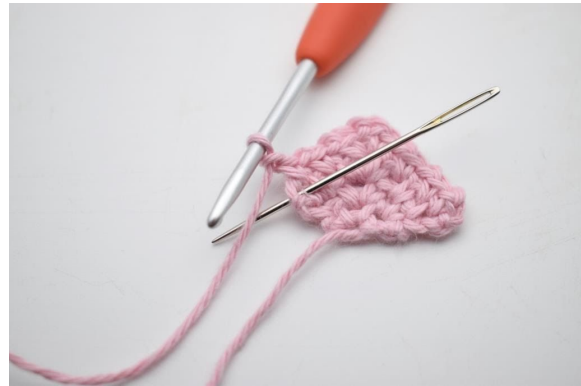
20. Häkle 1 fM in die letzte M.