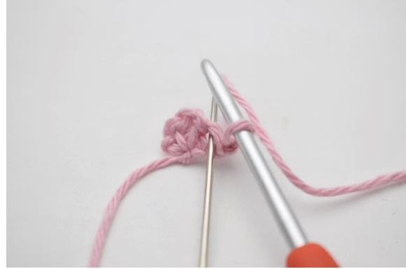
2. Häkle 1 fM in die erste M.