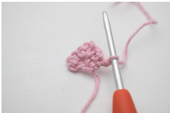
1. 1 Lm zum Wenden.