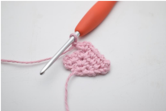
13. Bilde 1 Lm.