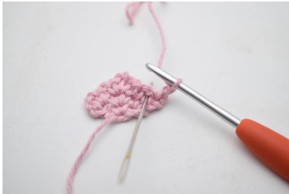
5. Häkle 1 fM in den Lm-Zwischenraum der vorherigen Reihe.