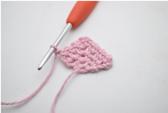
19. Bilde 1 Lm.