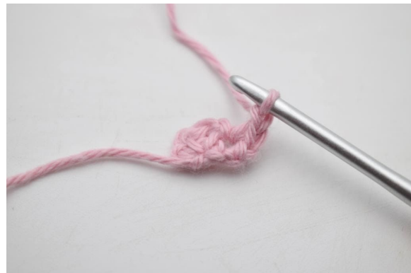
4. Bilde 1 Lm.