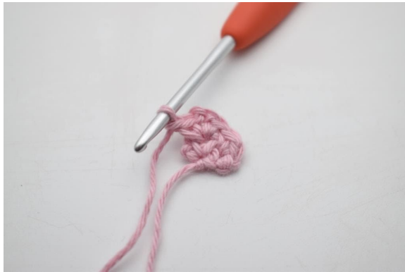
7. Bilde 1 Lm.