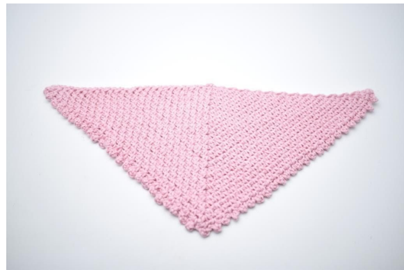
16. Faden abschneiden und vernähen.