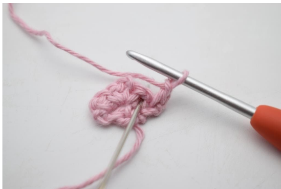
5. Häkle 1 fM in den Lm-Zwischenraum der vorherigen Reihe.