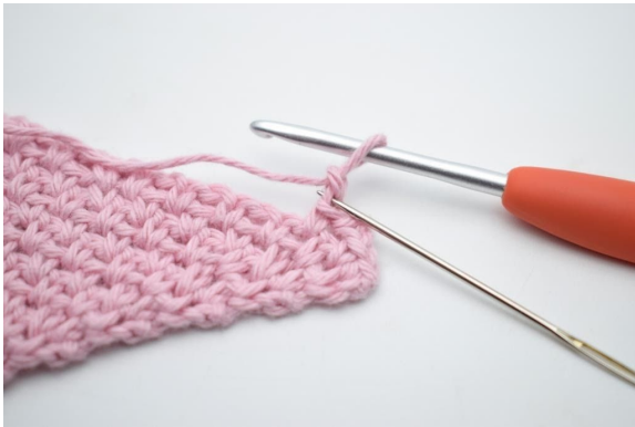
9. Häkle 1 Kettm in die 2. Lm ab Nadel.