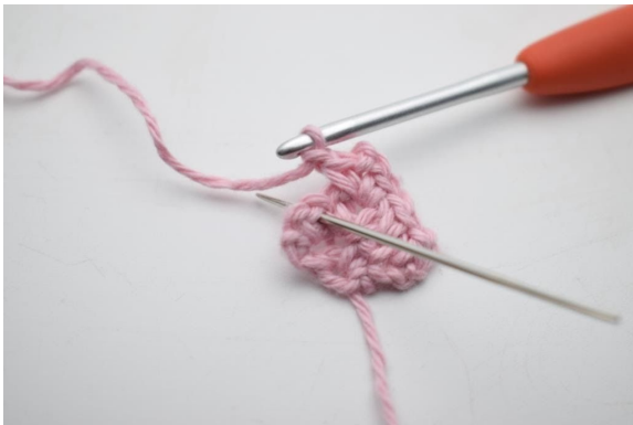
11. Häkle 1 fM in dem Lm-Zwischenraum der vorherigen Reihe.