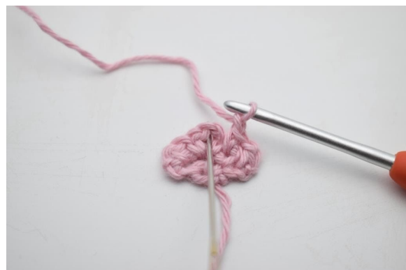
8. In den Lm-Bogen der vorherigen Reihe werden 1 fM, 2 Lm und 1 fM gehäkelt.