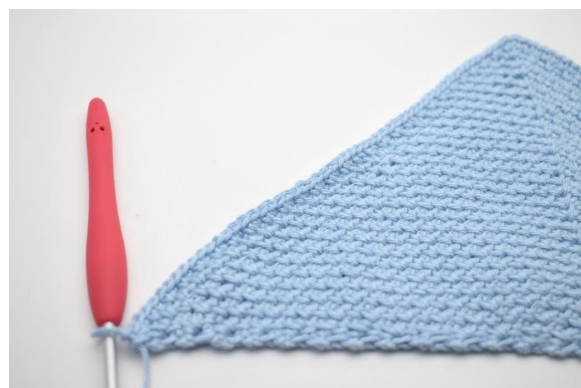
4. Auf der anderen Seite werden auch fM in alle M und alle fM-Zwischenräume gehäkelt.