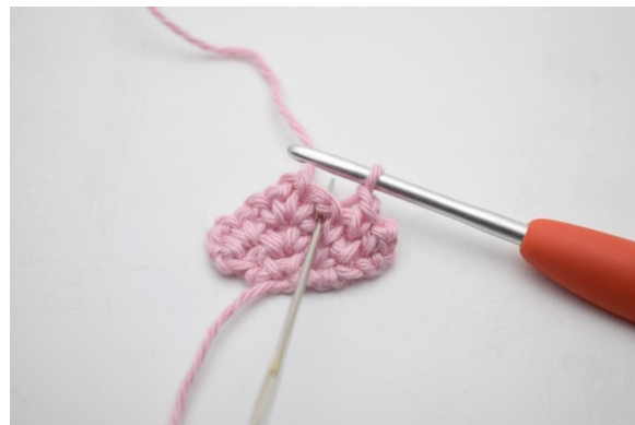
8. Häkle 1 fM in den nächsten Lm-Zwischenraum der vorherigen Reihe.