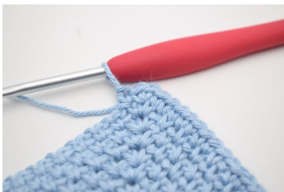
3. In den Lm-Bogen werden 2 fM gehäkelt.