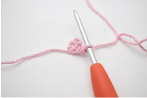
1. 1 Lm zum Wenden.