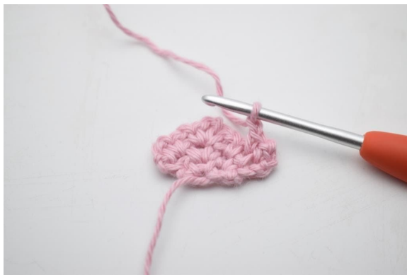
7. Bilde 1 Lm.