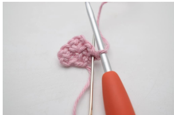
2. Häkle 1 fM in die erste M.