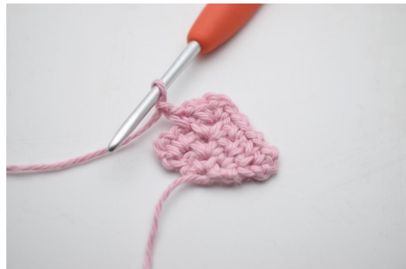
16. Bilde 1 Lm.