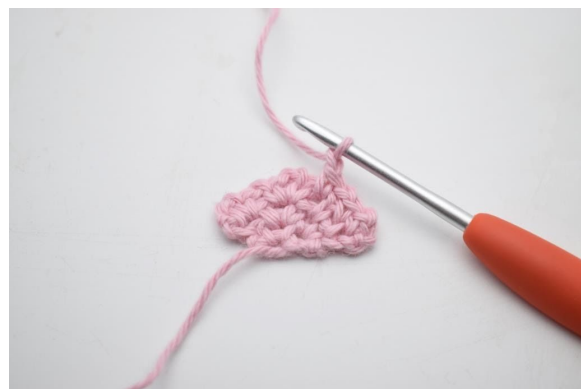
10. Bilde 1 Lm.