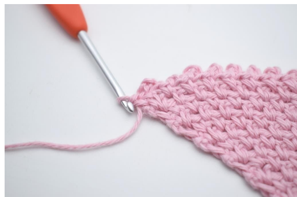
14. Wiederhole von „bis“ bis Reihenende. Beende die Reihe mit 1 fM in die letzte M.