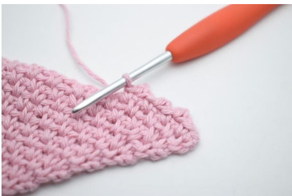
13. "Bilde 2 Lm, häkle 1 Kettm in die 2. Lm ab Nadel, überspringe 1 M und häkle 1 fM in den nächsten Lm-Zwischenraum".