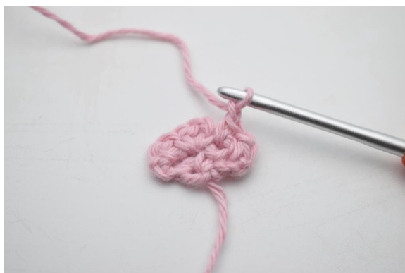
7. Bilde 1 Lm.