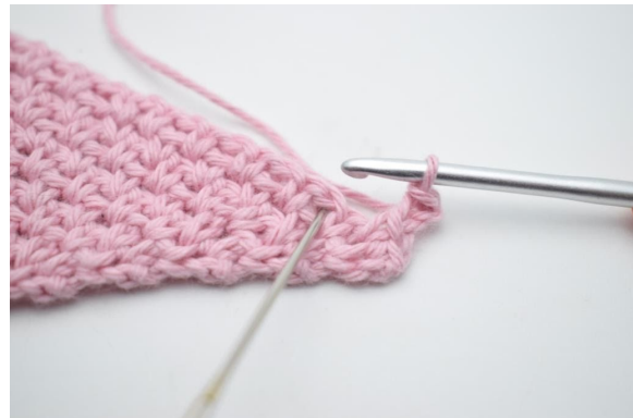
6. Überspringe 1 M und häkle 1 fM in den nächsten Lm-Zwischenraum".