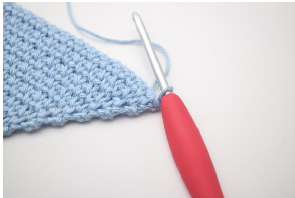
1. 1 Lm zum Wenden.