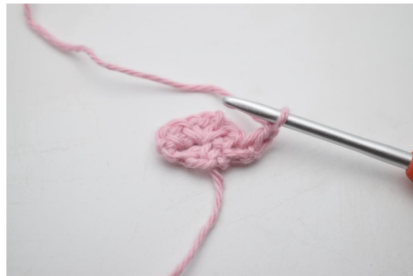
4. Bilde 1 Lm.