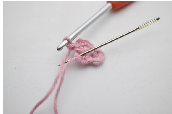
8. Häkle 1 fM in die letzte M.