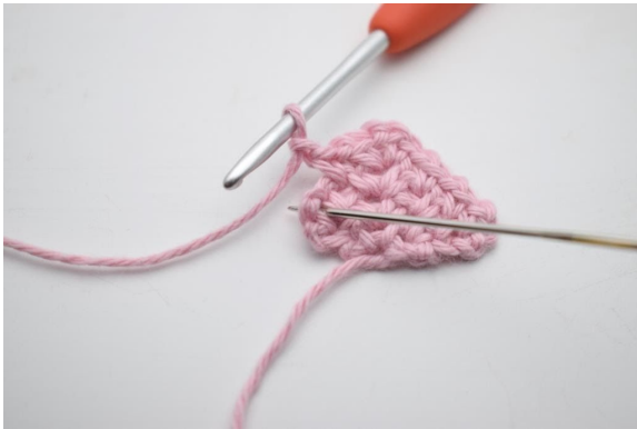
17. Häkle 1 fM in den nächsten Lm-Zwischenraum der vorherigen Reihe.