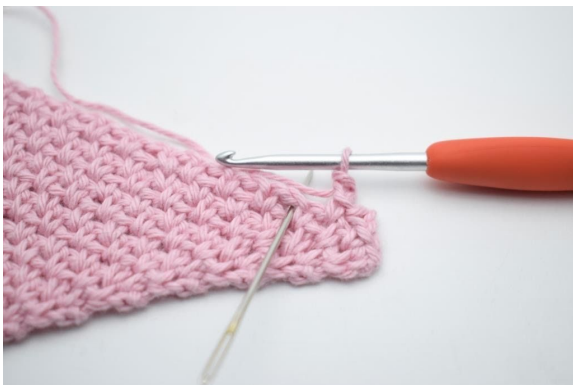
11. Überspringe 1 M und häkle 1 fM in den nächsten Lm-Zwischenraum.