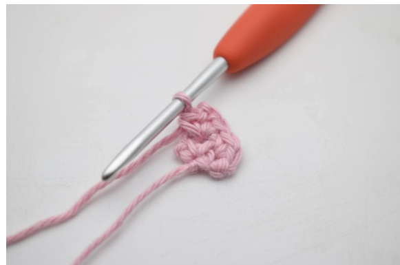
6. Genauso. Das wird die Spitze des Lätzchens sein.