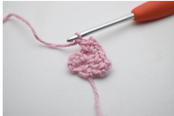
10. Bilde 1 Lm.