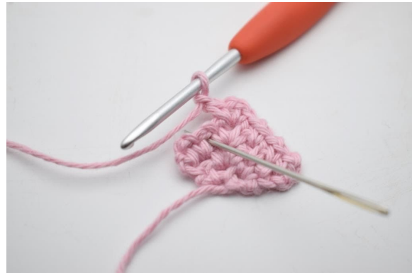
14. Häkle 1 fM in den Lm-Zwischenraum der vorherigen Reihe.