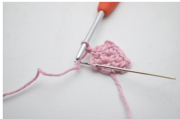
14. Häkle 1 fM in die letzte M.