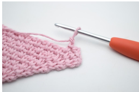
8. "Bilde 2 Lm.