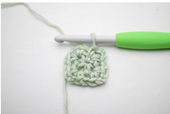
7. Wiederhole von "bis" insgesamt 3 Mal.