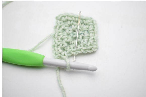
8. „Bilde 1 Lm und häkle 1 fM in den nächsten Lm-Bogen“.