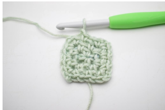
12. Bilde 1 Lm.