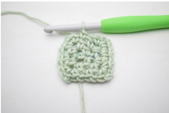
11. Wiederhole von "bis" insgesamt 3 Mal.