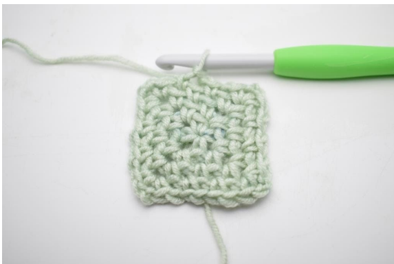
11. Wiederhole von (bis) insgesamt 3 Mal