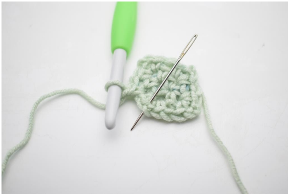
7. "Bilde 1 Lm, häkle 1 fM, 2 Lm und 1 fM in den nächsten Lm-Bogen.