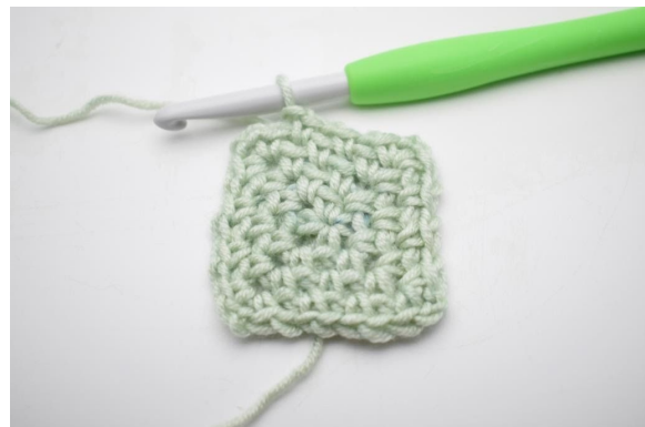
12. Bilde 1 Lm.