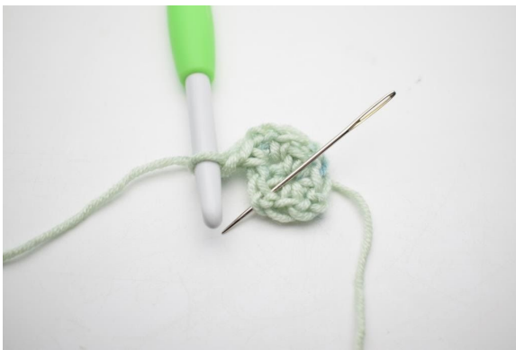
5. "Bilde 1 Lm, häkle 1 fM, 2 Lm und 1 fM in den nächsten Lm-Bogen".