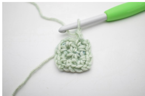
8. Bilde 1 Lm.