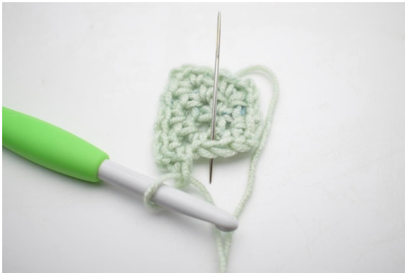
9. Bilde 1 Lm und häkle 1 fM in den nächsten Lm-Bogen".