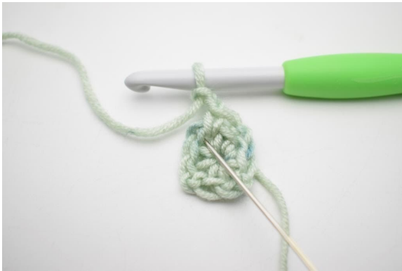
3. Bilde 2 Lm, häkle 1 fM in denselben Lm-Bogen.