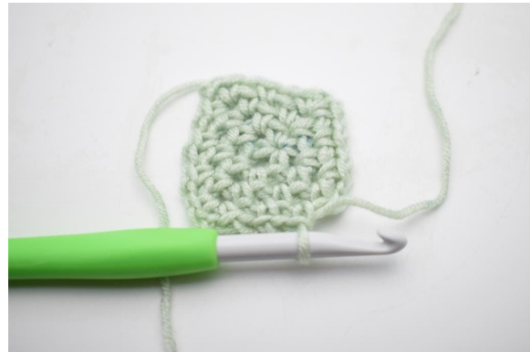
10. Wiederhole von "bis" insgesamt 2 Mal).