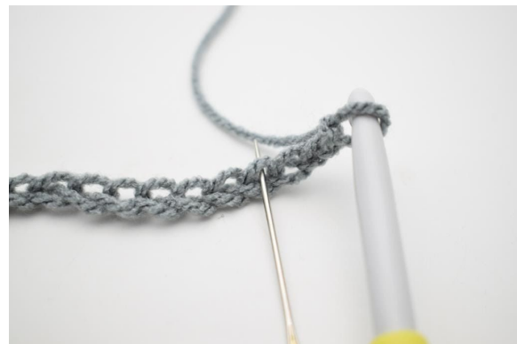
2. 1 fm in die 4. Lm ab der Nadel.