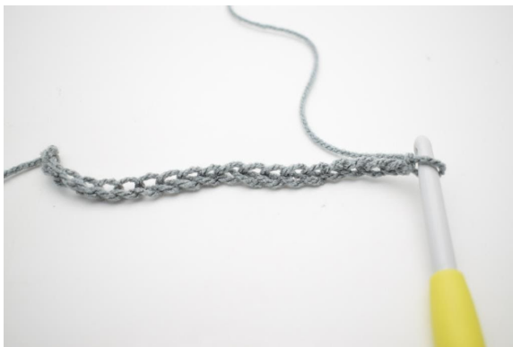
1. 196 Lm häkeln.