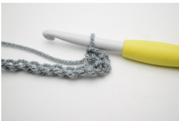
3. Genau so.