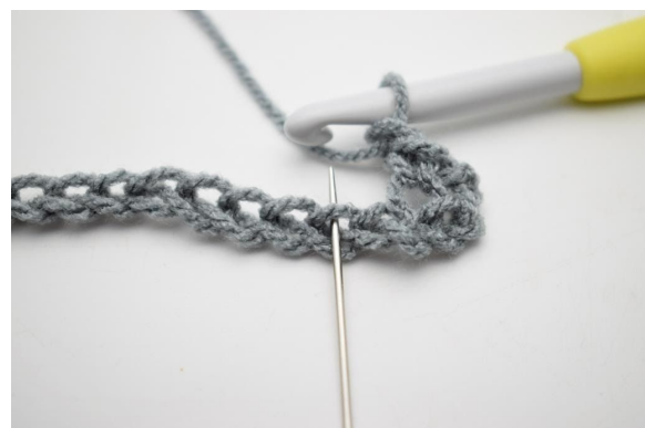
4. *Lav 1 Lm, 1 Lm überspringen und 1 fm in die nächste M häkeln*.