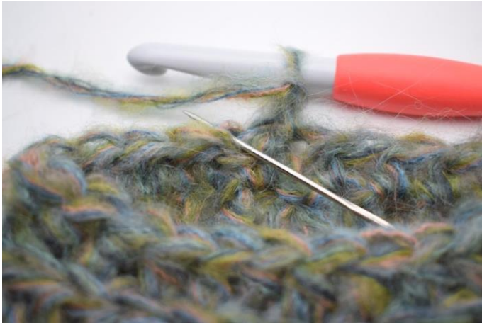
14. 1 hStb in das hMg der ersten M häkeln.