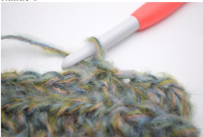
12. Die Runde wie Runde 3 häkeln. 1 Lm häkeln.