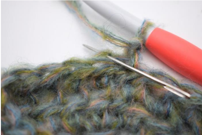
9. 1 hStb in das hMg der ersten M häkeln.