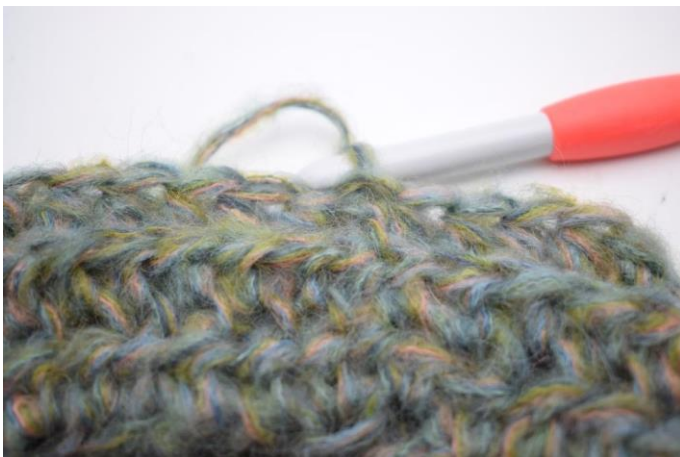
11. 1 Runde hStb in das hMg häkeln. Mit 1 Km in das erste hStb schließen. (58)