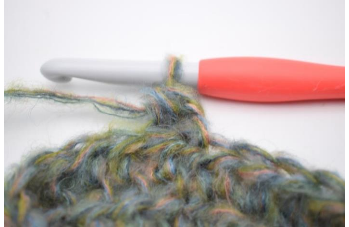
10. Genau so.