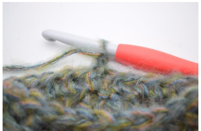
13. Die Arbeit wenden.