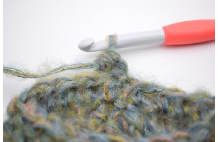
15. Genau so.