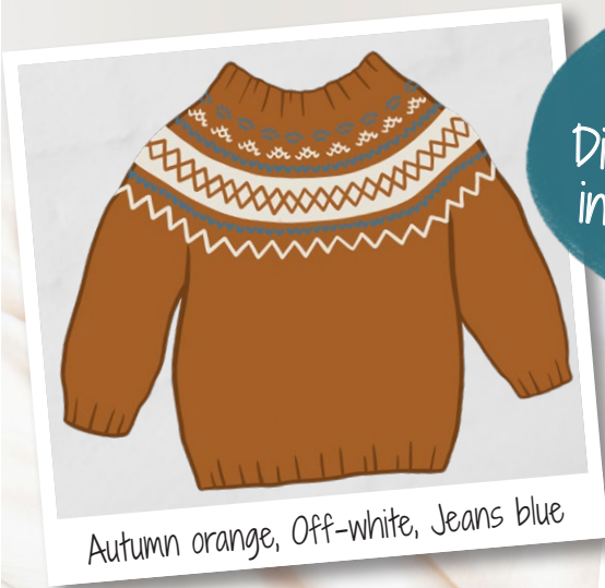
Autumn orange, Off-white, Jeans blue

Tipp Die Anleitung kann auch in 3 Farben gearbeitet werden