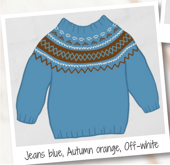
Jeans blue, Autumn orange, Off-white