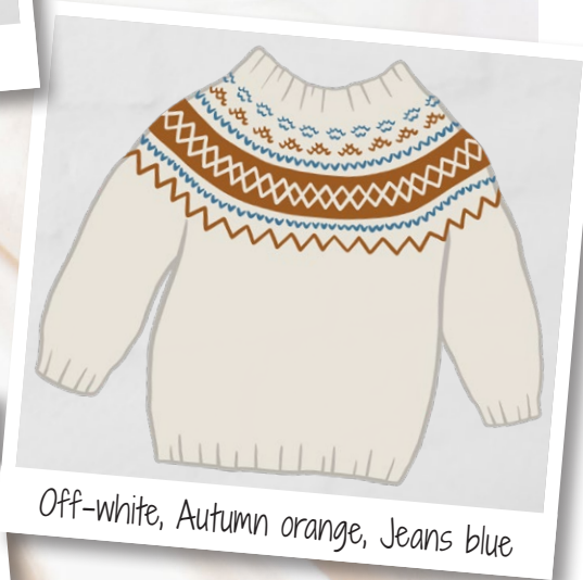
Off-white, Autumn orange, Jeans blue

Tipp Die Anleitung kann auch in 3 Farben gearbeitet werden