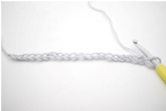
1. Deine Luftmaschenkette häkeln.