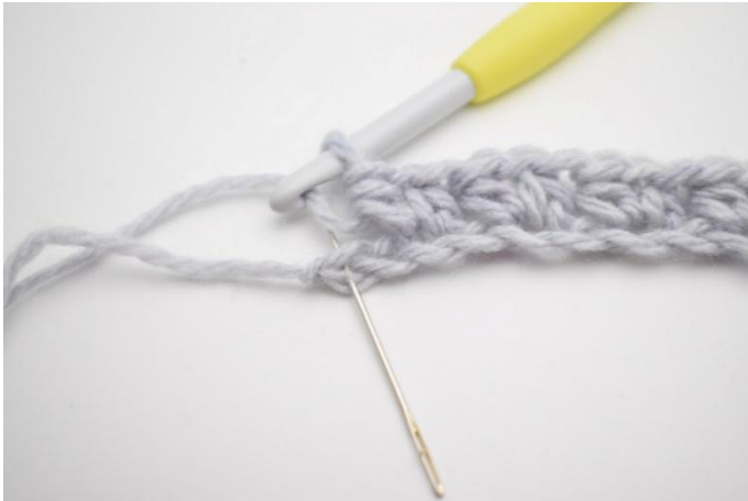
9. 1 M überspringen und 1 hStb in die letzte M.