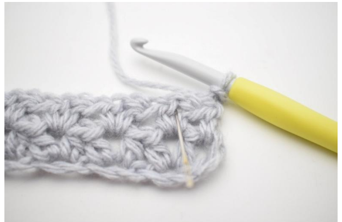
2. *1 hStb, 1 Lm und 1 hStb in den ersten Lm-Zwischenraum der vorigen Reihe*. Die Nadel zeigt, wo gehäkelt wird.