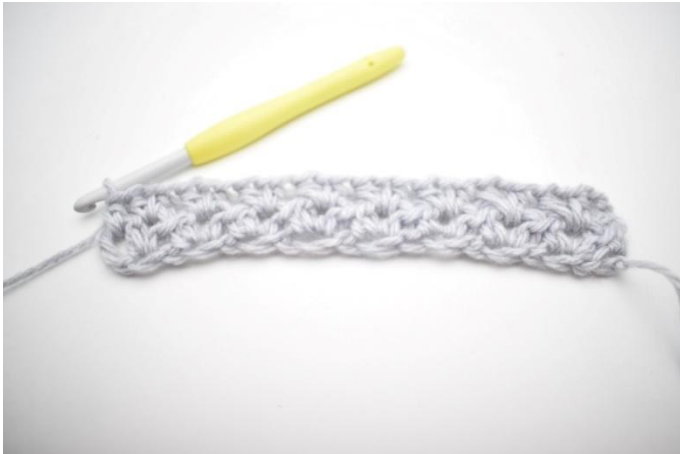
9. Das war Reihe 2.