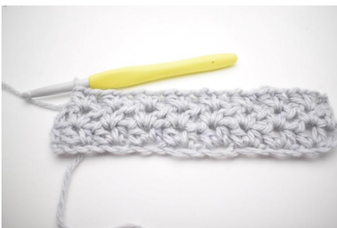
3. Wiederhole von * bis * auf der Runde.