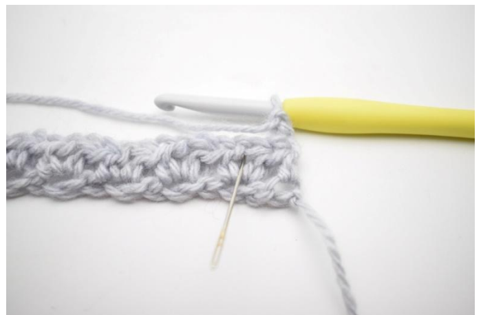
2. *1 hStb, 1 Lm und 1 hStb in den Lm-Zwischenraum der vorigen Reihe*. Die Nadel zeigt hier in welchen Lm-Zwischenraum gehäkelt wird.