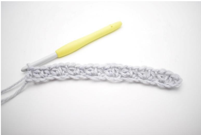
11. Das war die erste Reihe.