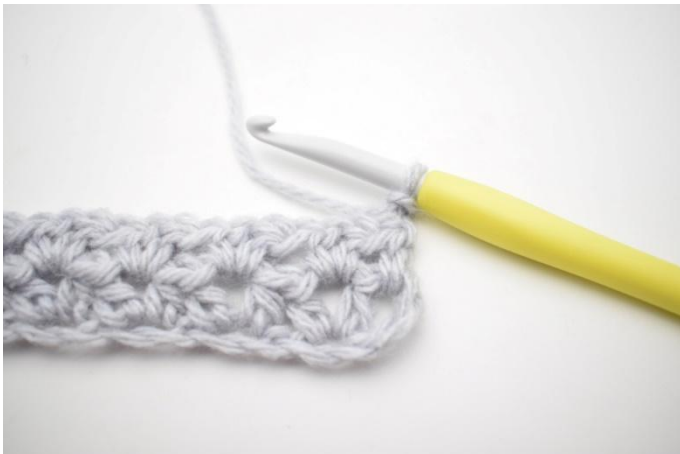
1. Reihe 3 wird wie Reihe 2. gehäkelt. Die Arbeit mit 2 Lm wenden.