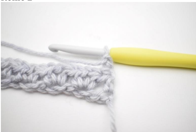
1. Die Arbeit mit 2 Lm wenden.