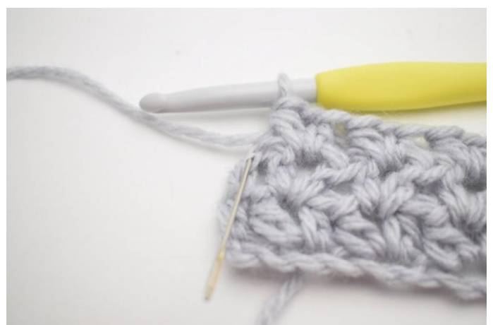
4. 1 hStb in die letzte M häkeln.