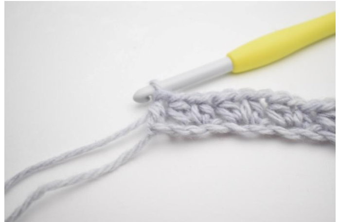
10. Genau so.