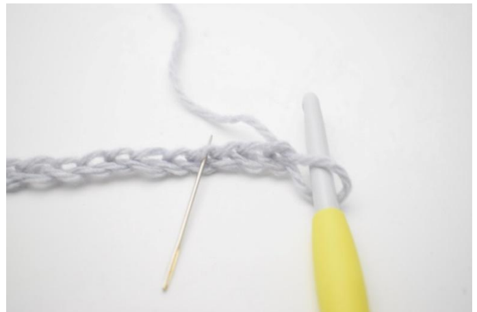
2. In die 4. Lm ab der Nadel 1 hStb, 1 Lm und 1 hStb häkeln. Die Nadel zeigt die Lm in die gehäkelt wird.