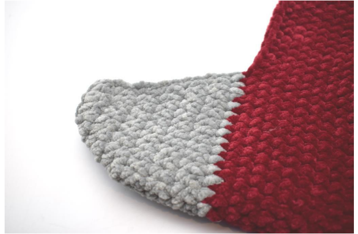
Nähe die Ferse an der Außenkante auf der linken Seite zusammen. Deine Ferse ist jetzt fertig.