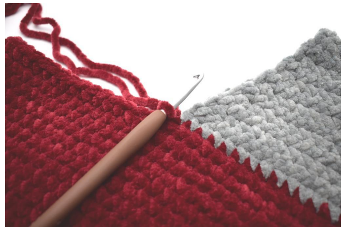
Den roten Faden einsetzen.