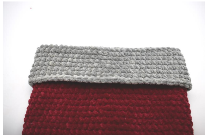
Den Rand über die Socke umschlagen.