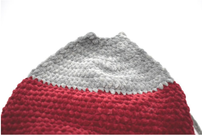
So sieht die Ferse aus.