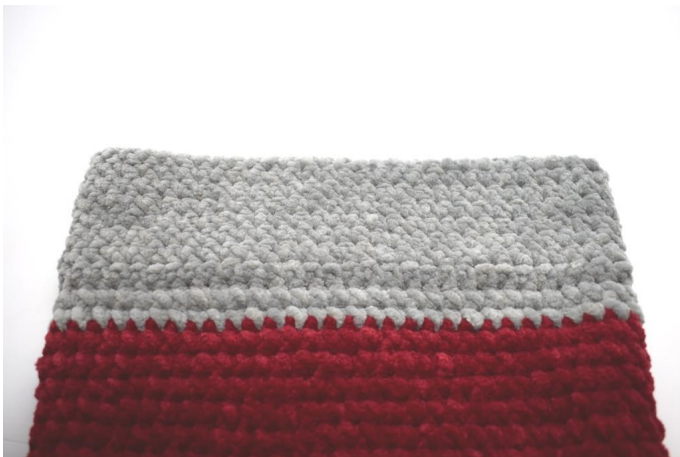
Der Rand ist jetzt fertig gehäkelt.

Schließe mit 1 Km, den Faden abschneiden und vernähen.