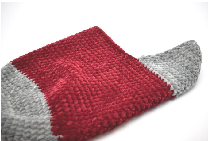
Die Socke wenden.