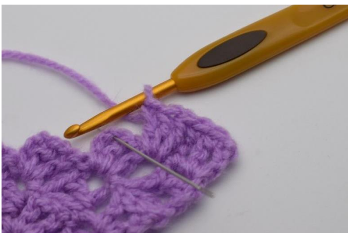
5. 2 Stb überspringen und 1 fm in den Lm-Bogen häkeln.