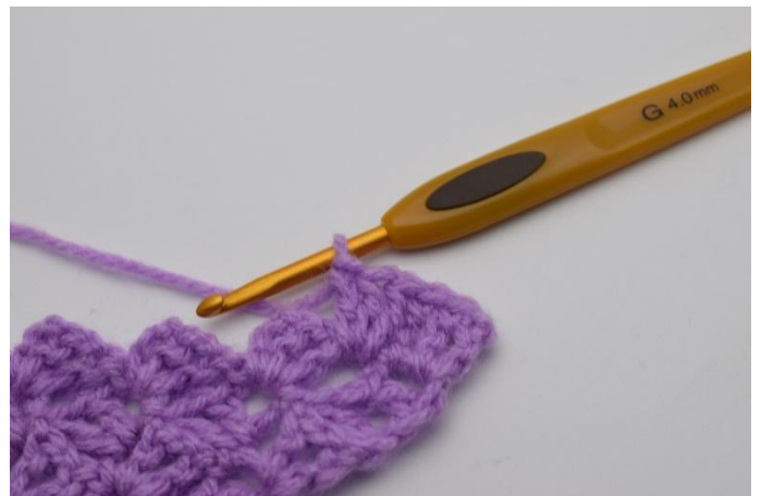
4. 3 Stb häkeln.