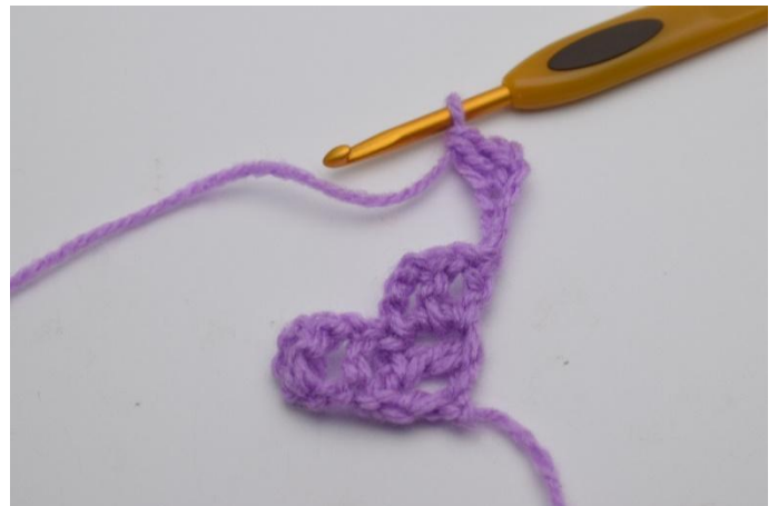
2. 1 Stb in die 4. Lm ab der Nadel häkeln.