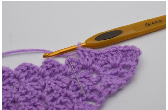
8. 2 Stb überspringen und 1 fm in den Lm-Bogen häkeln.