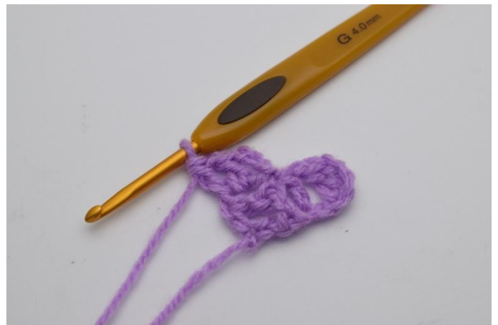
8. Jetzt ist noch ein "Viereck" entstanden. Die Reihe 2 hat jetzt 2 "Vierecke".