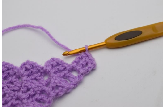
2. 1 fm in die 2 Stb.