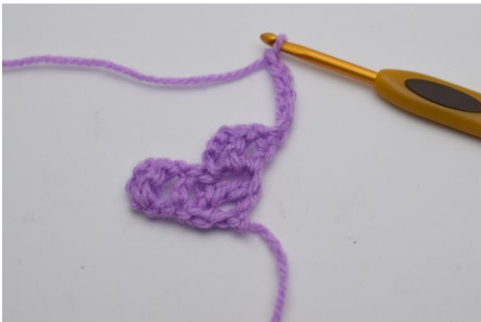
1. Die Arbeit wenden und 6 Lm häkeln.