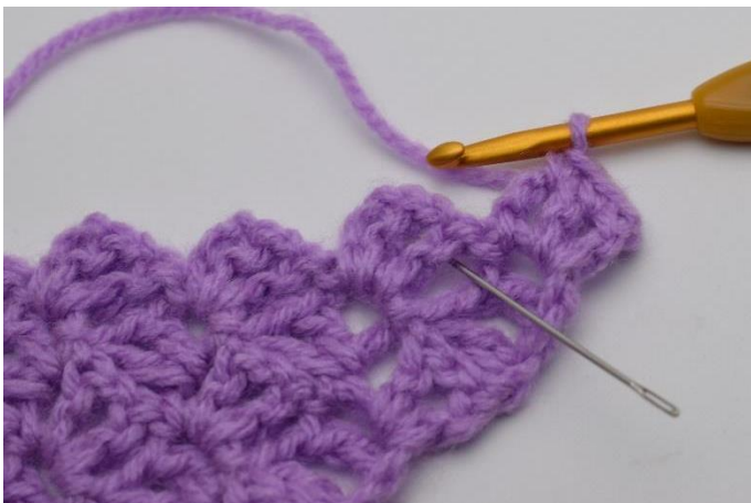
3. Jetzt wird zwischen die "Vierecke" der beiden vorigen Reihen gehäkelt. Die Nadel hier zeigt, wo du häkeln sollst.