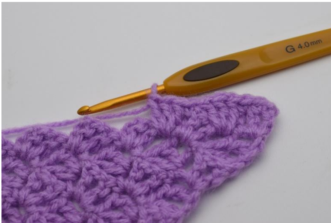
7. Genau so.