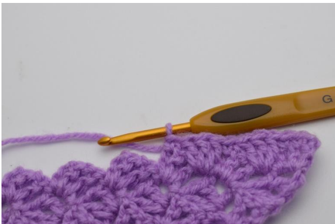
9. Genau so.