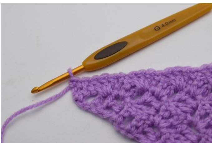
11. Schließe mit 1 fm in das letzte Stb. Den Faden abschneiden und vernähen.