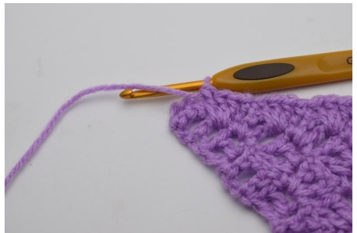
10. Auf der Reihe wiederholen.