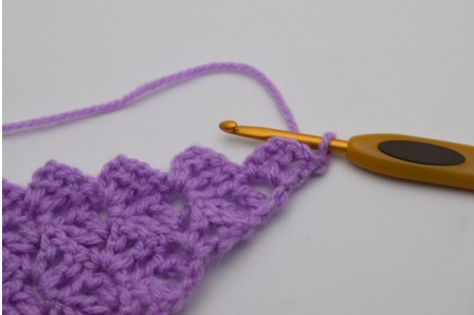
1. Die Arbeit mit 1 Lm wenden.