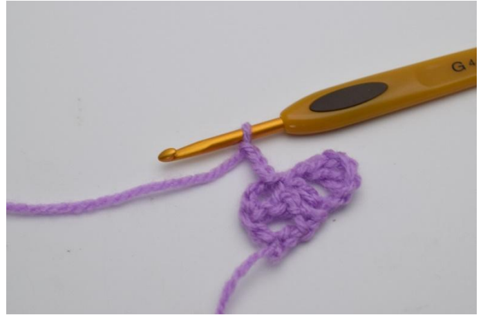
6. 3 Lm häkeln.