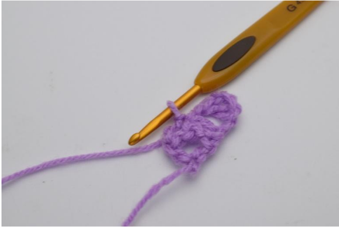
5. Genau so.