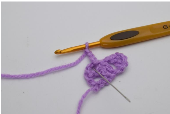
7. *1 Stb, 1 Lm und 1 Stb* in den Lm-Bogen, in den du eben 1 Km gehäkelt hast.