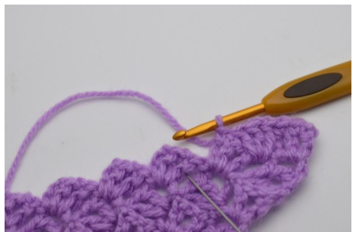
6. Genau so. 3 Stb zwischen die "Vierecke" der beiden vorigen Reihen häkeln. Die Nadel hier zeigt, wo du häkeln sollst.