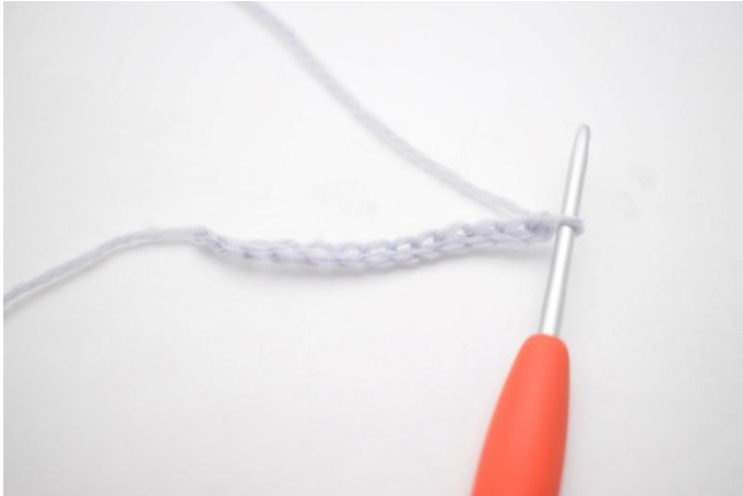
1. 25 Lm häkeln.