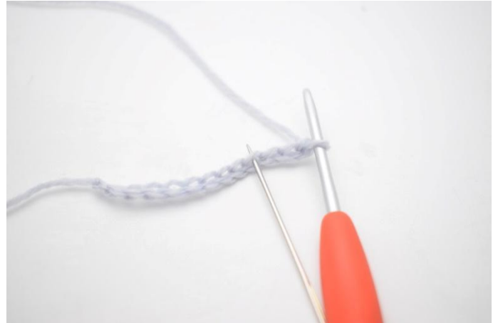
2. 1 Stb in die 4. Lm ab der Nadel häkeln.