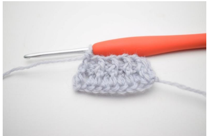
8. 1 RStb-v um die nächste M häkeln.