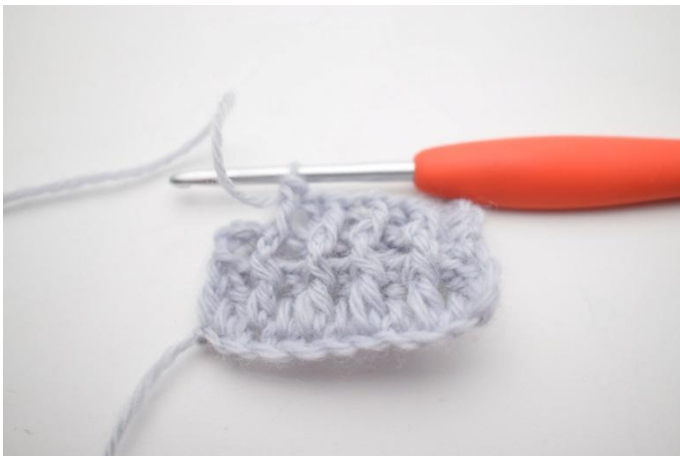
7. Wiederhole *-* bis noch 2 M übrig sind.