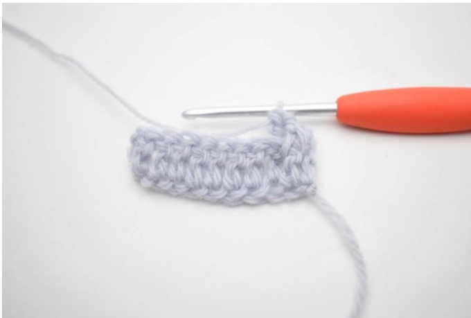
5. Genau so.