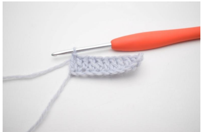
4. 1 Reihe Stb häkeln. (23)