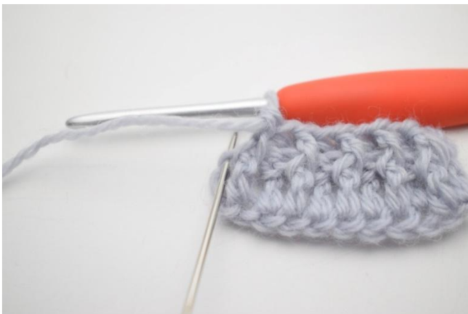
9. 1 normales Stb in die letzte M häkeln.