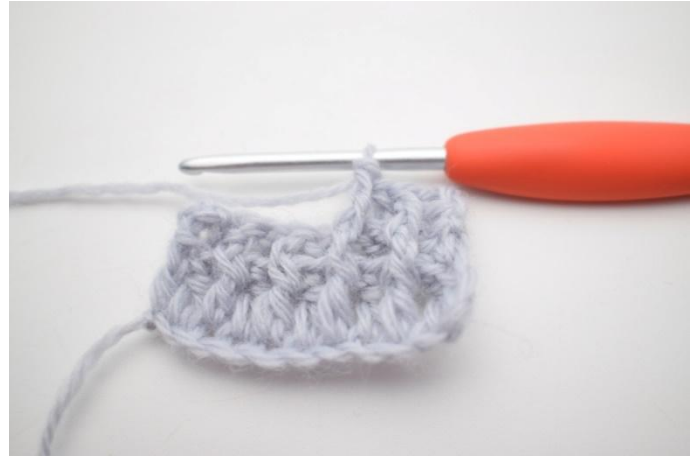
6. *1 RStb-h um die erste M häkeln, 1 RStb-v um die nächste M häkeln*.