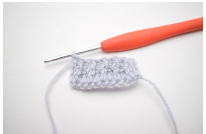
10. Genau so.