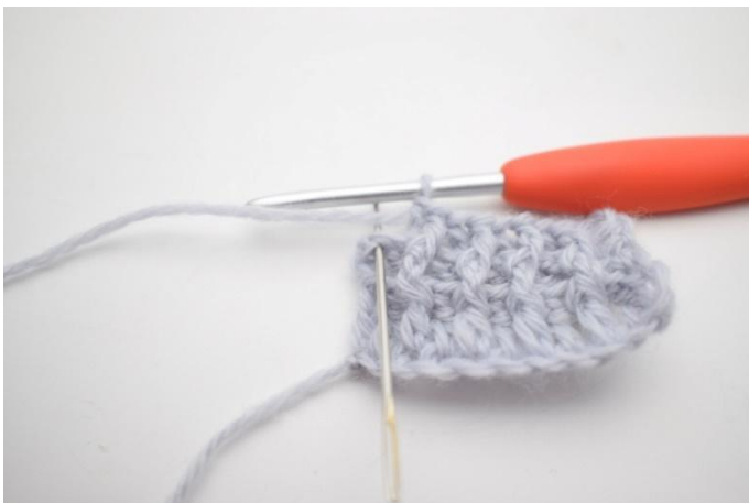
9. 1 normales Stb in die letzte M häkeln.