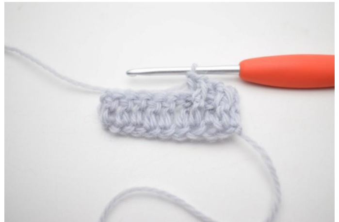
6. *1 RStb-v um die nächste M häkeln, 1 RStb-h um die folgende M*.