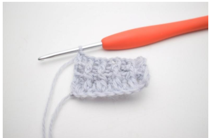
10. Genau so.