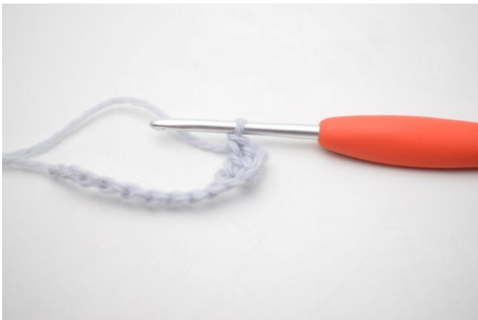
3. Genau so.