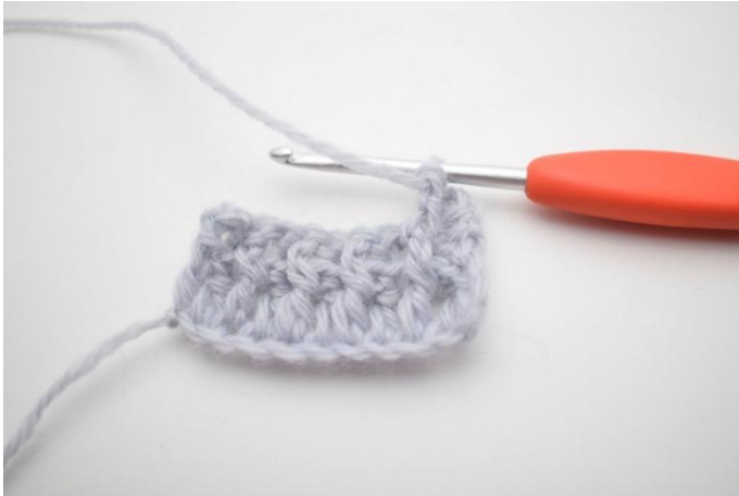
5. Genau so.