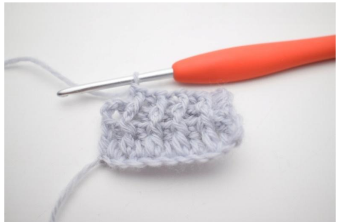
8. 1 RStb-h um die nächste M häkeln.