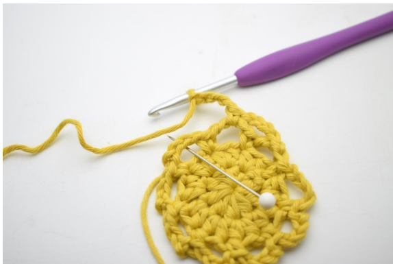
17. *4 Lm häkeln, 1 fM in den nächsten Lm-Bogen*.