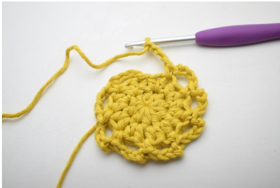
10. Wiederhole von * bis * auf der Runde.