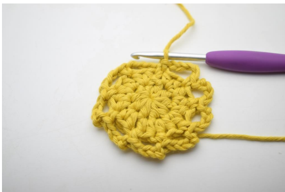
12. Genau so. (9 Lm-Bögen)