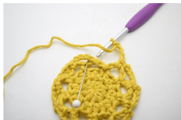
20. Die Runde endet 1 fM in den ersten der Lm-Bögen, die in dieser Runde gebildet wurden.