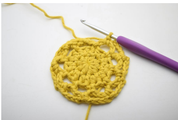
19. Wiederhole von * bis * auf der Runde.