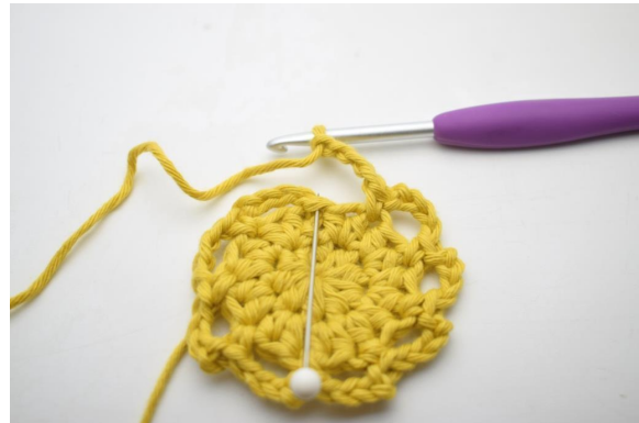
11. Schließe mit 1 Km.