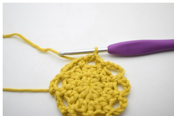
14. Genau so.