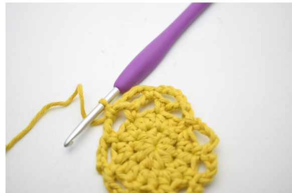
18. Genau so.