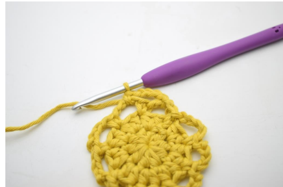
16. Genau so.