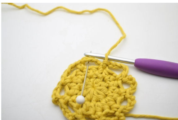
13. Häkle 2 Km entlang dem ersten Lm-Bogen, so dass du in der Mitte davon beginnst.