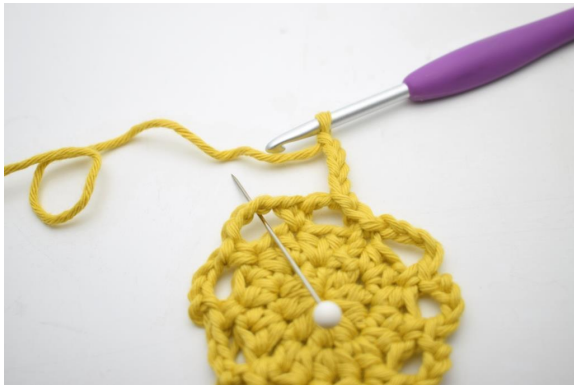
15. *4 Lm häkeln, 1 fM in den nächsten Lm-Bogen*.