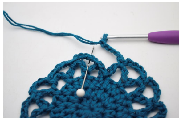
20. Die Runde mit 1 fM in den ersten der Lm-Bögen schließen, die in dieser Runde gebildet wurden.