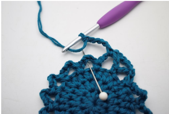
18. *5 Lm häkeln, 1 fM in den nächsten Lm-Bogen*.