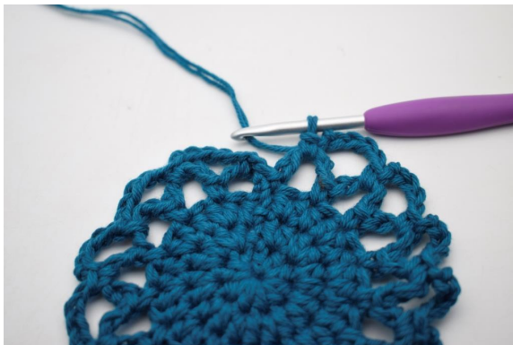
20. Wiederhole von * bis * auf der Runde.