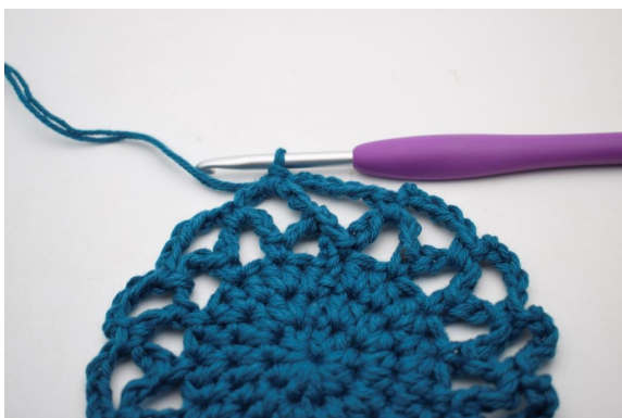
21. Genau so. (15 Lm-Bögen)