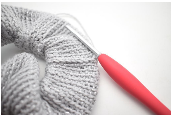
15. Auf der Runde wiederholen.