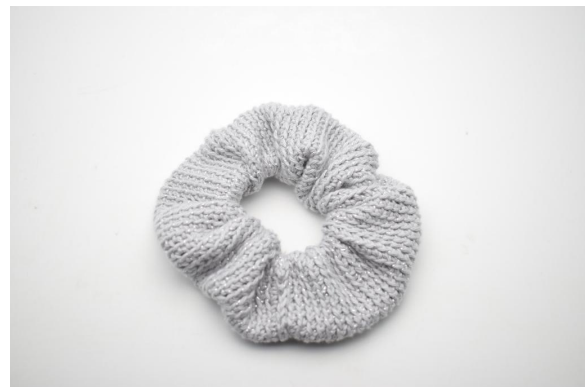
16. Den Faden abschneiden und vernähen.