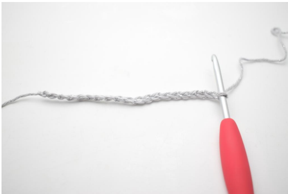
1. 20 Luftmaschen häkeln.