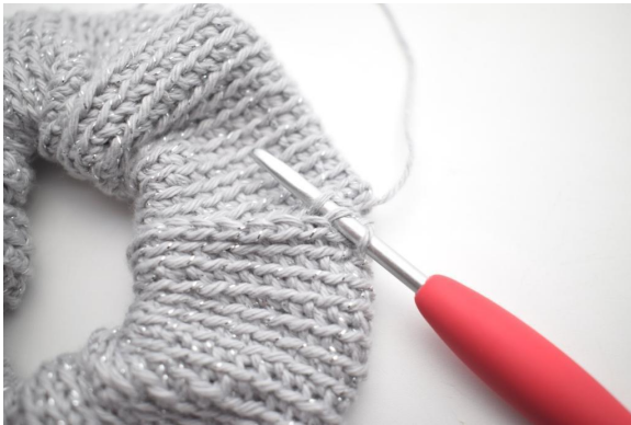
13. 1 km durch das nächste hMg und das nächste Maschenglied aus der Lm-Kette.