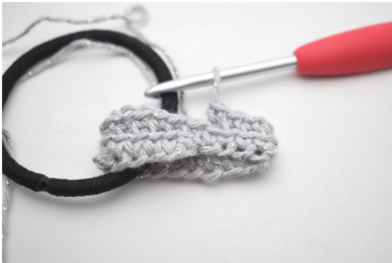
8. 1 Runde fm in das hMg häkeln. (20).