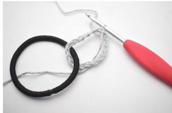
2. Die Lm mit einer Km zu einem Ring um das Haargummi schließen.