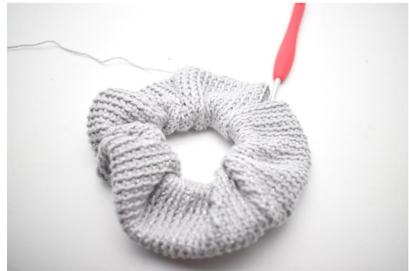
10. Wiederhole die 2. Runde bis insgesamt 95 Runden gehäkelt sind.