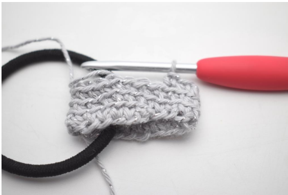
9. Wiederhole die Vorgehensweise von Runde 2.