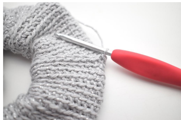
12. Genauso. Jetzt ist 1 km gehäkelt.