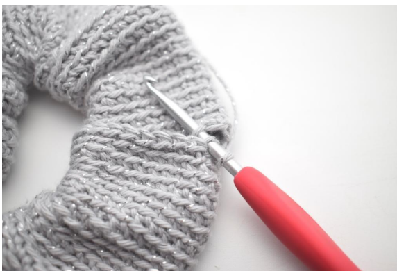
11. Den Schlauch zusammenhäkeln, indem km durch das hMg und die Luftmaschenkante gehäkelt wird.