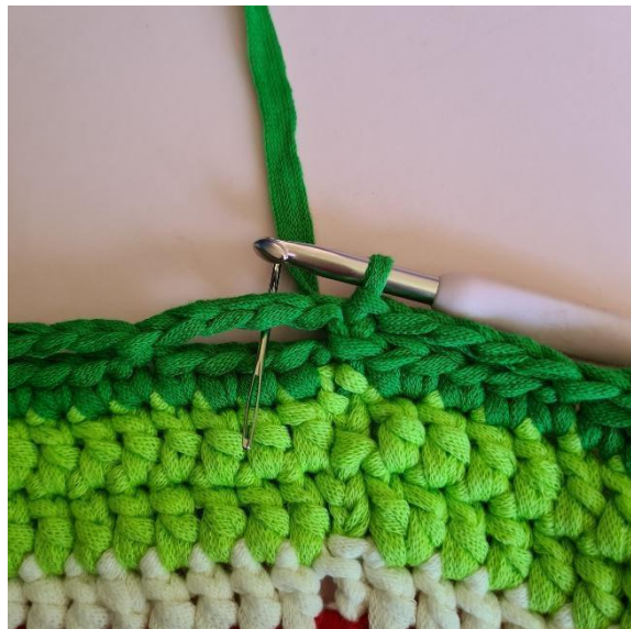
[3 fm, Lm, 3 fm]