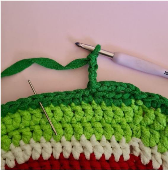
4 Lm, 4 M überspringen,