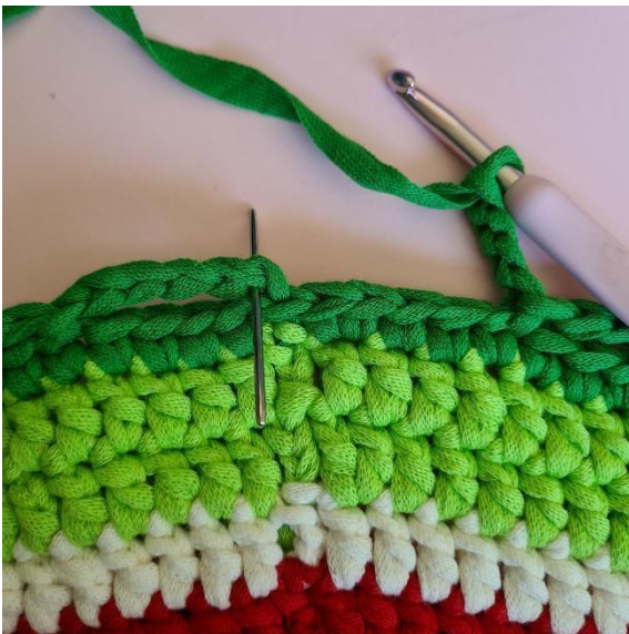
Schliesse mit 1 Km in die erste Lm