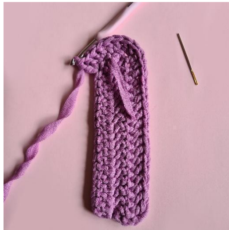
8. [Zun] x5,