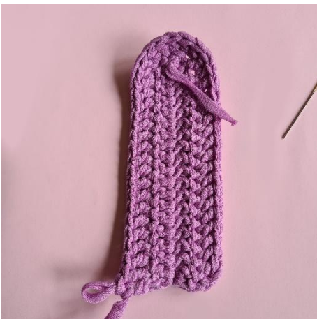
9. 16 Stb. 1 st in die Wlm. Wenden