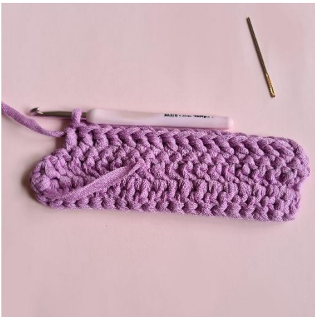
7. 16 Stb .