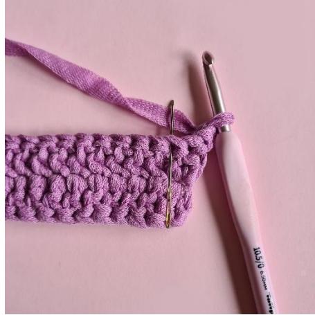
2 Lm, die erste M überspringen