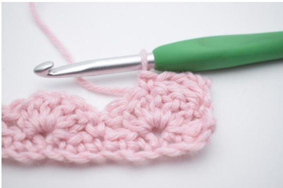
5. 1 fM in die nächste M häkeln.