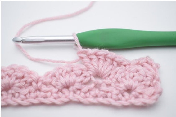
7. 5 Stb in die nächste M häkeln.