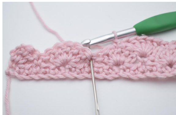
10. 2 M überspringen,