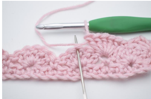
8. 2 M überspringen,