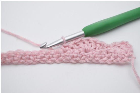
9. 1 fM in die nächste M häkeln.