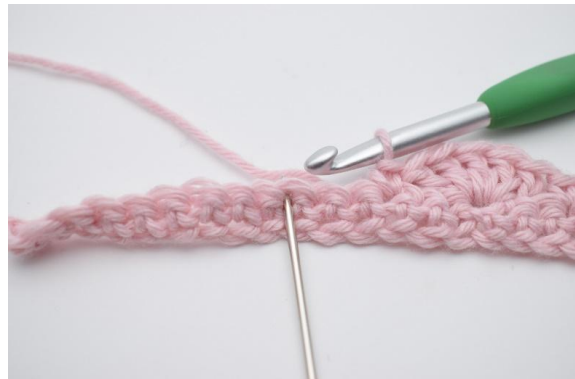
10. 2 M überspringen,