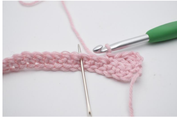
6. 2 M überspringen,