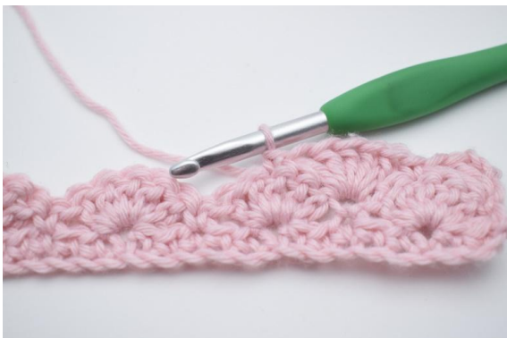
9. 1 fM in die nächste M häkeln.