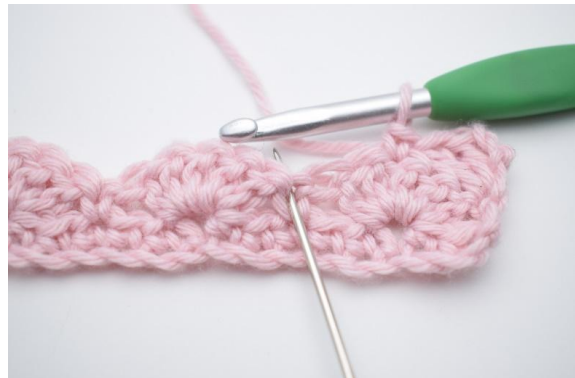
6. 2 M überspringen,