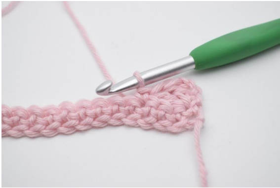
5. 1 fM in die nächste M häkeln.