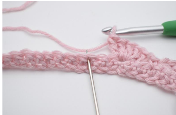
8. 2 M überspringen,