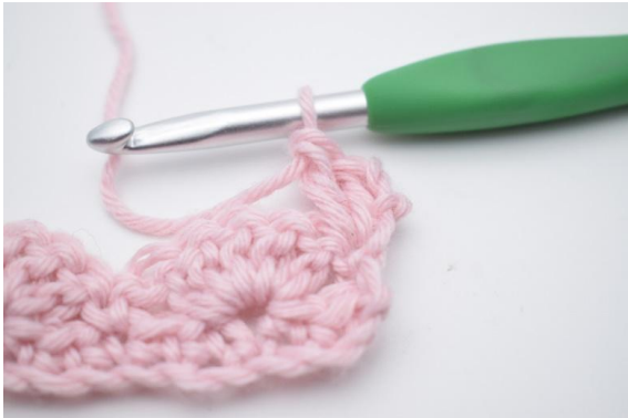
3. 2 Stb häkeln.