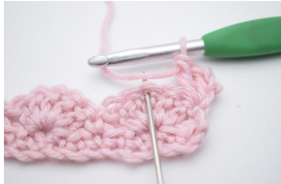
4. 2 M überspringen,