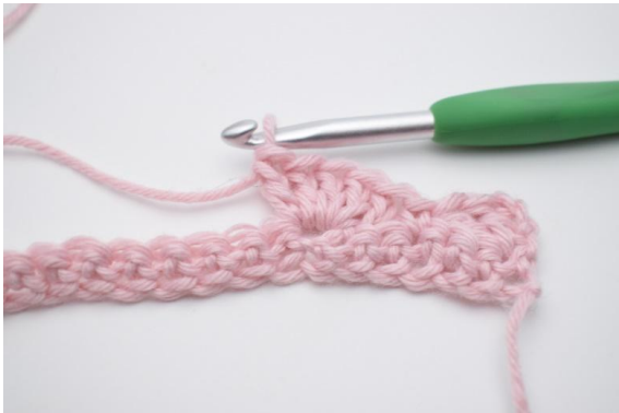
7. 5 Stb in die nächste M häkeln.