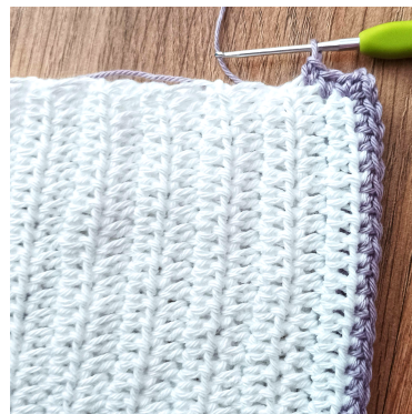
Sc around the back of the bonnet