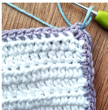
Join a new color in den 2-Lm-Bogen