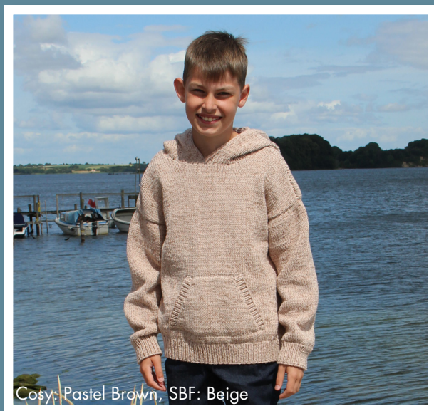
Cosy: Pastel Brown, SBF: Beige

Der Schlüssel, um eine bestimmte Größe zu stricken liegt größtenteils im Strickstil/den Händen/dem Talent und nicht in der Nadelgröße. Deshalb empfehlen wir eine Reihe von Nadelgrößen.