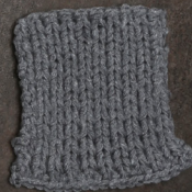
Cosy: Grey SBF: Grey