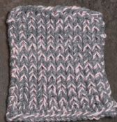
Cosy: Grey SBF: Light Pink