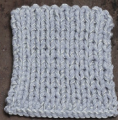
Cosy: Sky blue SBF: Light Grey