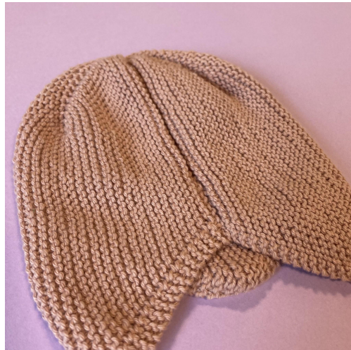
Den Anschlagrand mit dem abgeketteten Rand zusammennähen