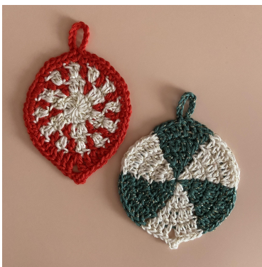
Das Pfefferminz- und das Grüner-Wirbel-Ornament

Runde 4: [2 Lm (zählt durchgehend als erstes hStb), hStb]. 2 Stb, [DStb, 3 Lm, fM in die erste Lm, DStb]. 2 Stb, [2 hStb], 2 hStb, {[2 fM], 2 fM}, { } noch 3-mal wiederholen, [fM, 10 Lm, Km in die fM, fM], 2 fM, { } noch 3-mal wiederholen, [2 fM], 2 hStb. Km oben in die 2 Lm, abmaschen (48 M und 2 Lm-Bögen).