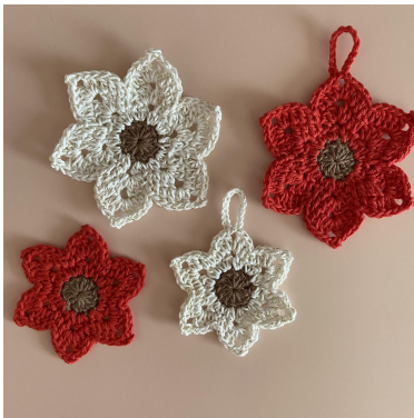
Der kleine und der große Weihnachtsstern

Runde 3: 1 Lm (zählt als erste fM), Stb. In den 3-Lm-Bg [2 Stb, 15 Lm, fM in die erste der 15 Lm, 2 Stb], Stb, fM. {fM, Stb, in den 3-Lm-Bg [2 Stb, 3 Lm, fM in die erste der 3 Lm, 2 Stb], Stb, fM}. { } noch 4-mal wiederholen. Km oben in die 1 Lm, abmaschen. (48 M + 6 Lm-Bg).