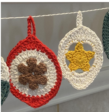
Das Popcorn- und das Sternen-Ornament

Runde 4: 3 Lm, 2 Stb, [2 DStb], [2 DStb], 3 Stb, [2 hStb], hStb, 6 fM, 3 hStb, [2 hStb], 3 Stb, [2 DStb], [DStb, 10 Lm, Km in das DStb, DStb], 3 Stb, [2 hStb], 3 hStb, 6 fM, hStb, [2 hStb], Km oben in die 3 Lm, abmaschen (48 M + 10-Lm-Bg).