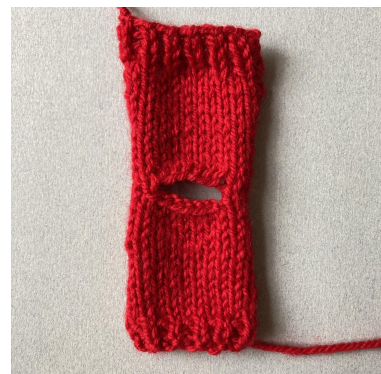
Fertiges Vorder- und Rückenteil