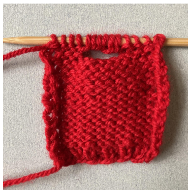
Anschlag für den Halsausschnitt, Rückenteil