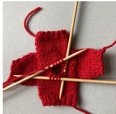
Auffassen der Maschen für den Kragen