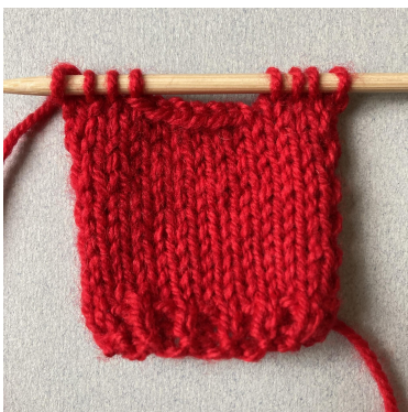
Abketten für den Halsausschnitt, Vorderteil

Kette für den Halsausschnitt ab: Stricke 4 M, kette 6 M ab, stricke 4 M