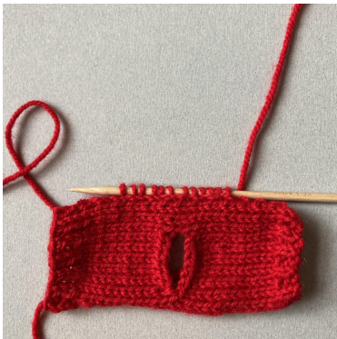
Auffassen der Maschen für den Ärmel