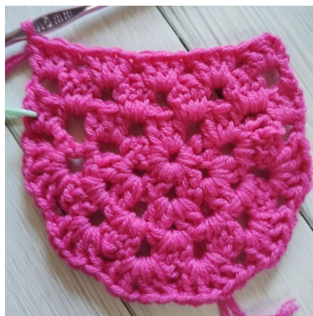
Das Bild zeigt die ersten drei flachen Reihen

Nach Abschluss von Reihe 17 nicht abmaschen. Drehe stattdessen die runde Kante von unten nach links, sodass dass die lange gerade Kante nach oben zeigt (die Häkelnadel befindet sich rechts davon).