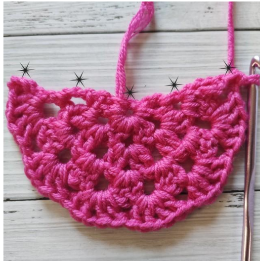
Das Bild zeigt die Bögen, in die die 3-Stb-Muscheln gearbeitet werden.

Platziere den Halbkreis mit der geraden Kante nach oben und arbeite entlang dieser Kante wie folgt: