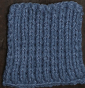
Cosy: Jeans Blue SBF: Jeans Blue