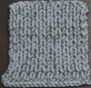
Cosy: Sky Blue SBF: Soft Green