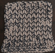
Cosy: Pastel Brown SBF: Dark Grey