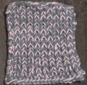
Cosy: Grey SBF: Light Pink