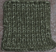
Cosy: Hunting Green SBF: Soft Green