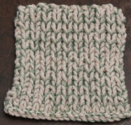
Cosy: Pastel Brown SBF: Soft Green