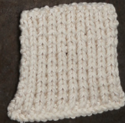
Cosy: Off White SBF: Off White