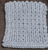
Cosy: Sky blue SBF: Light Grey