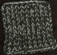
Cosy: Hunting Green SBF: Off White