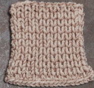
Cosy: Pastel Brown SBF: Nude Beige