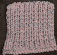
Cosy: Pastel Rose SBF: Light Grey