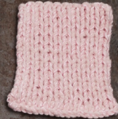
Cosy: Pastel Rose SBF: Light Pink