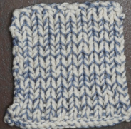
Cosy: Off White SBF: Jeans Blue