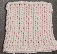
Cosy: Off White SBF: Light Pink