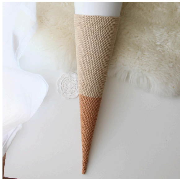
6. Mit Farbe 05 wurde 25 cm gehäkelt.