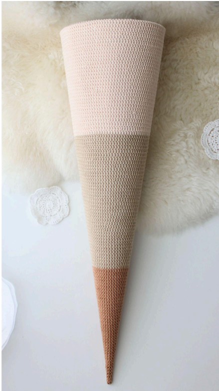
7. Mit Farbe 04 wurde 20 cm gehäkelt.