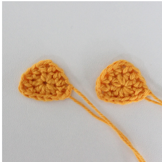
Ohren - Farbe 26

Dieses Detail wird genauso gehäkelt wie beim Hund.