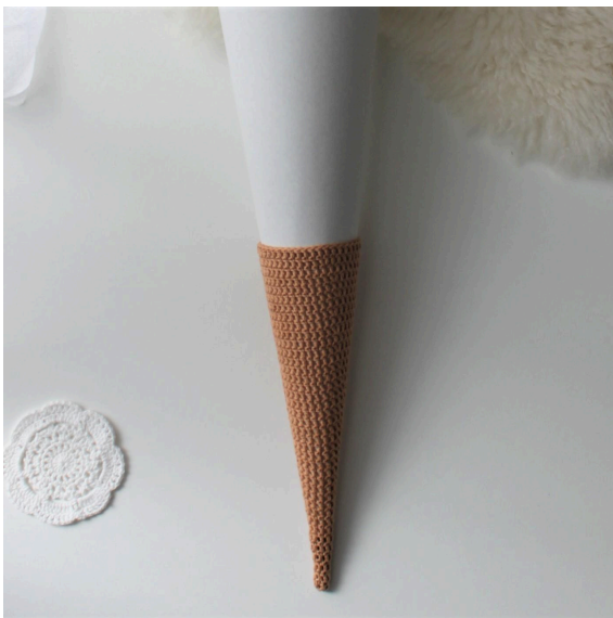
5. Mit Farbe 09 wurde 25 cm gehäkelt.

Ab hier werden in jeder 2 Reihe 2 St. zugenommen. Diese Zunahmen sollten immer an einer anderen Stelle gemacht werden.