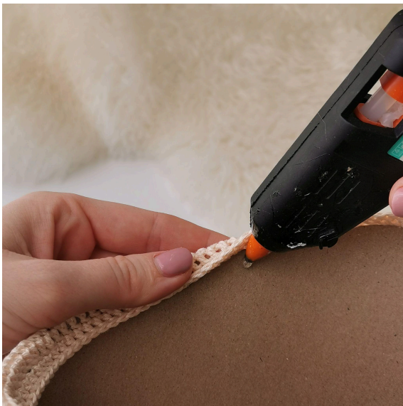
9. Jetzt wird es mit einer Heißklebepistole angeklebt.