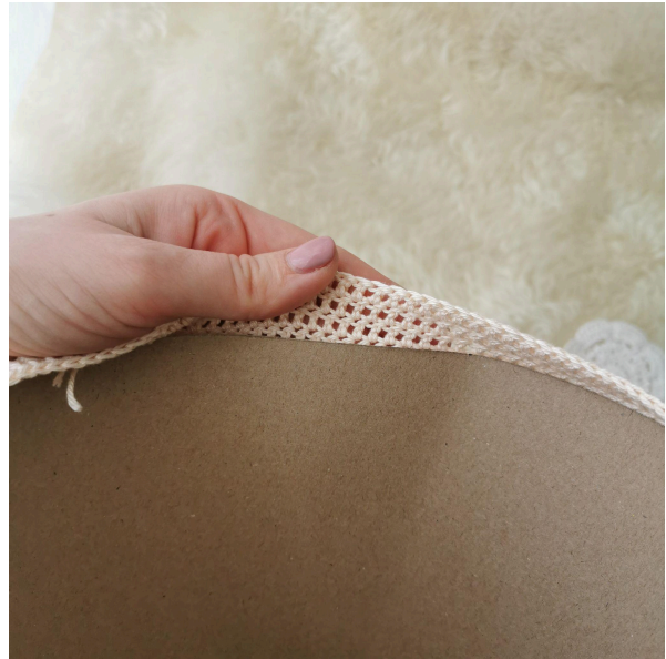
8. Hier sollte man die letzten 3 Reihen über den Rohling häkeln.