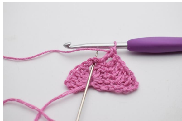
4. In den LmBg werden 2 Stb, 2 Lm, 2 Stb gehäkelt.