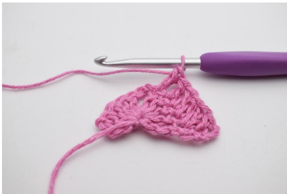
3. 1 Stb in die nächsten 4 M häkeln.