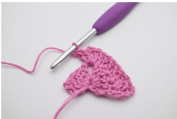
5. Genau so