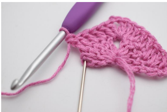
7. In die letzte M werden 2 Stb und 1 DStb gehäkelt.