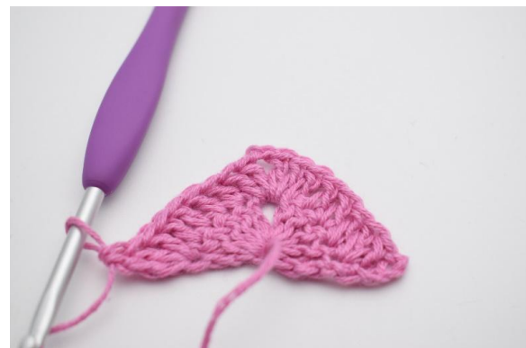
8. Genau so.