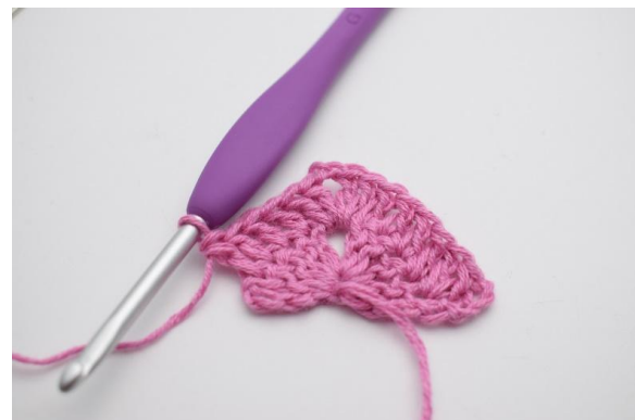
6. 1 Stb in die nächsten 4 M häkeln.