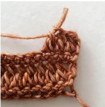
7. Das ‚forked cluster‘ ist fertig!