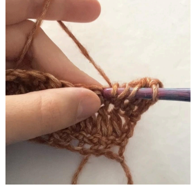
3. In die nächste Masche einstechen