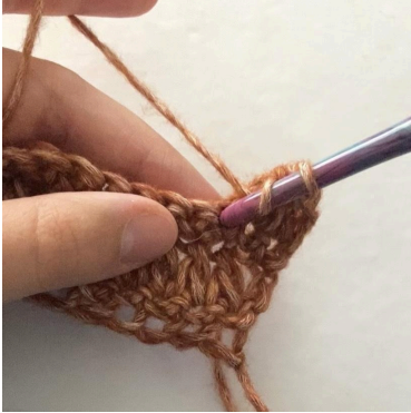
1. U, in die gerade gemachte vorherige Masche einstechen