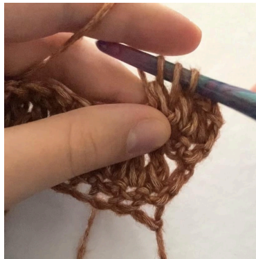
5. Durch 3 Schlaufen ziehen, U