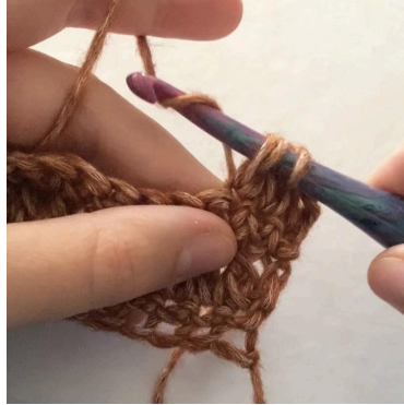
2. (3 Schlaufen auf der Nadel), U