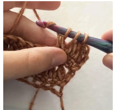
6. Durch die nächsten 3 Schlaufen ziehen