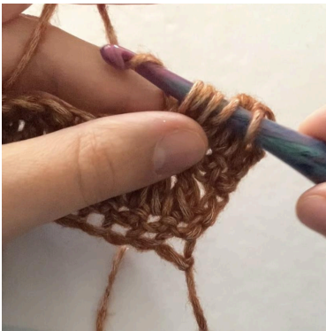
4. (5 Schlaufen auf der Nadel), U