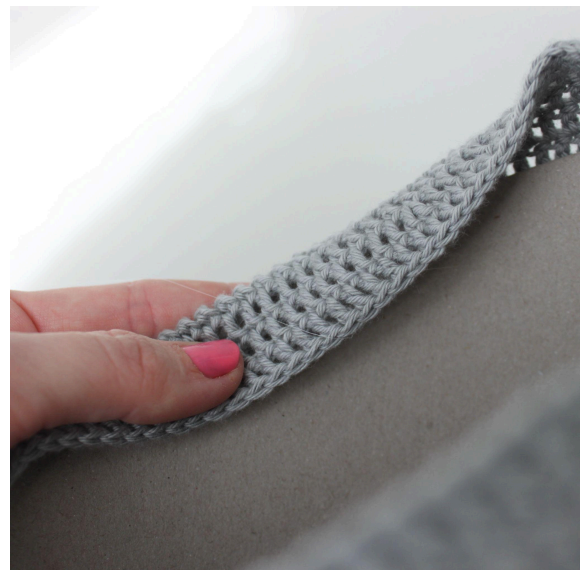
8. Und an der Innenkante ankleben.