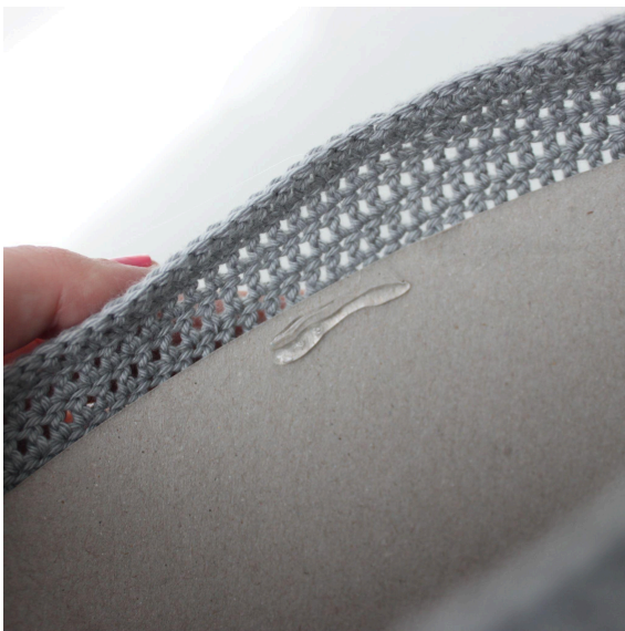
7. Heißklebepistole oder Kleber benutzen