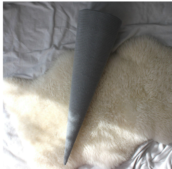
6. So arbeitest du weiter bis 3 cm über dem Rohling hinaus.