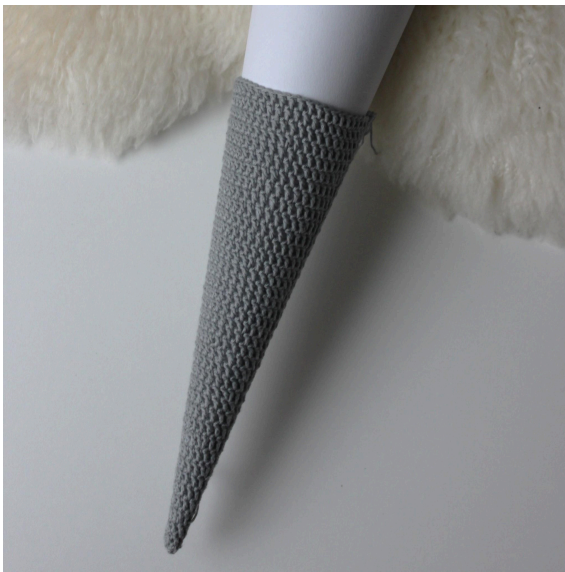
5. Probiere bitte immer dein Häkelstück an.

Ab hier werden in jeder 2 Reihe 2 St. zugenommen. Diese Zunahmen sollten immer an einer anderen Stelle gemacht werden.