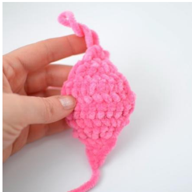
11. Die anderen Seite ist fertig