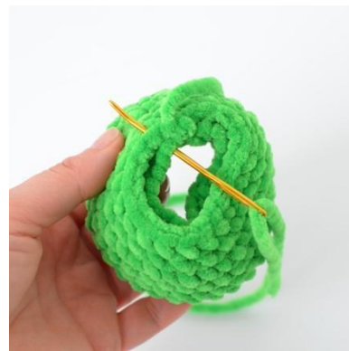
4. Nähe die erste und die letzte Runde zusammen