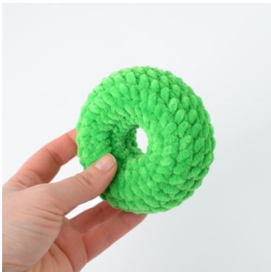
5. Der fertige Ring