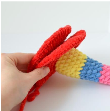
19. Setze die Basis oben auf das untere Ende des Stabs