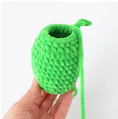
3. alle Runden sind fertig