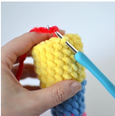
17. Häkle ins vMg