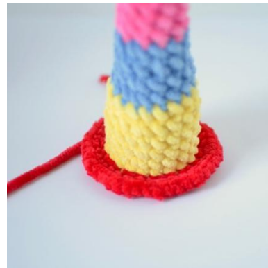
18. Häkle ins vMg