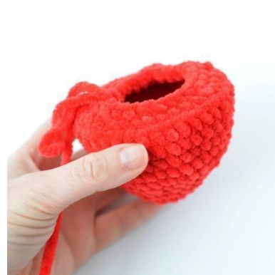
6. Häkelle ins hMg, um einen flachen Boden zu erhalten