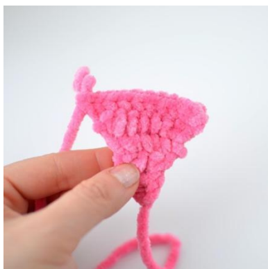
9. Die erste Seite ist fertig