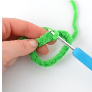
2. die erste und die letzte M zusammenhäkeln