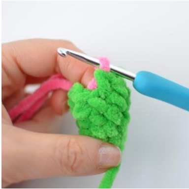
15. Wechsle die Farbe