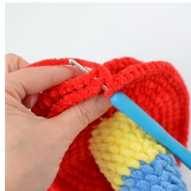
20. Verbinde die Teile mit KM