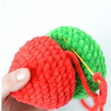
7. die vMg an den Ring nähen