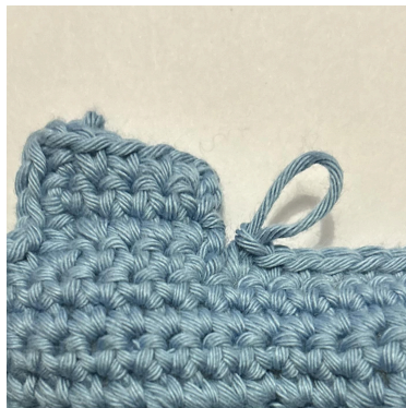
Arbeite 1 fM in die letzte verfügbare M vor der Ecke.