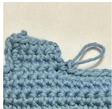
Arbeite dann 1 fM in das erste verfügbare Reihenende nach der Ecke.