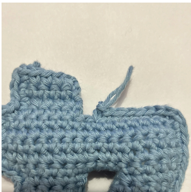
Wenn du an eine nach innen gerichtete Ecke kommst: