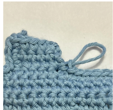
Arbeite dann 1 fM in das erste verfügbare Reihende nach der Ecke.