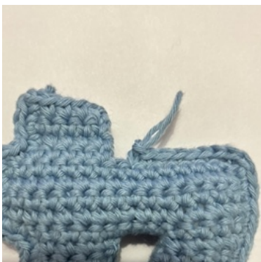
Wenn du an eine nach innen gerichtete Ecke kommst: