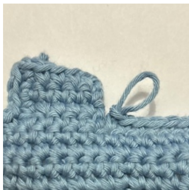
Arbeite 1 fM in die letzte verfügbare M vor der Ecke.