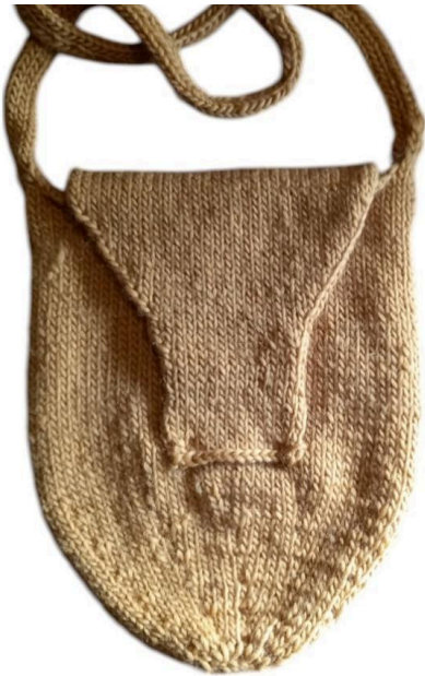
Vor dem Filzen