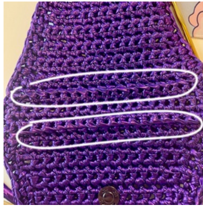
Vorderseite des Projekts.