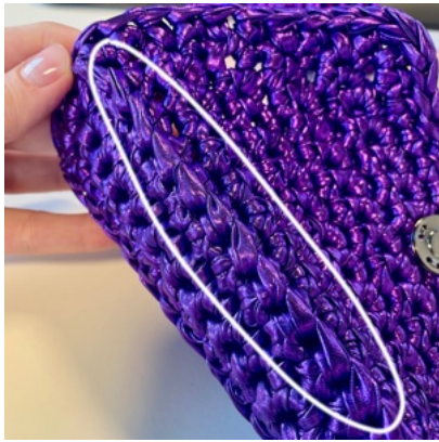
Vorderseite des Projekts.